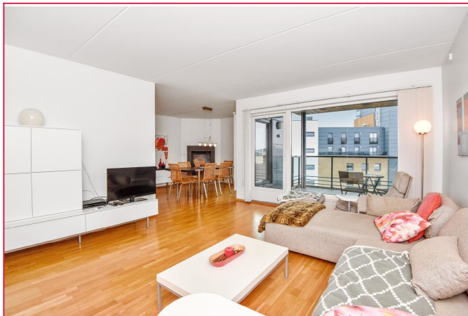
Stue med utgang til balkong