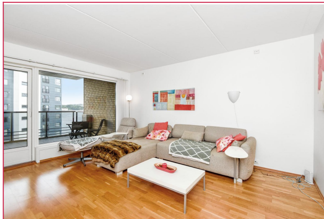
Koselig og romslig stue