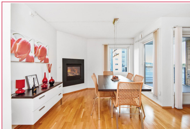
Hyggelig spisestue med peis og store vinduflater