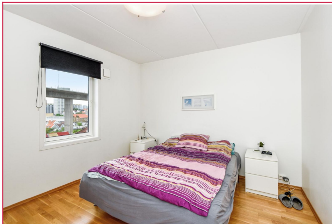
Soiverom med plass til dobbelseng