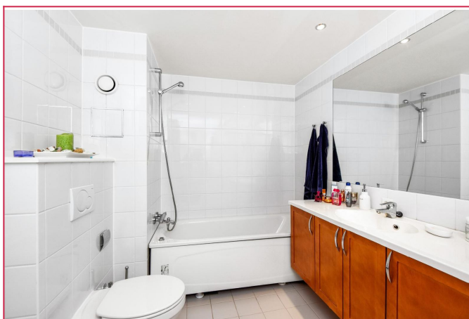
Bad innredet med badekar og vegghengt toalett