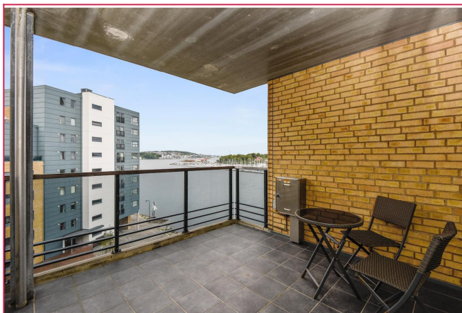
Balkong med fin utsikt over sjøen