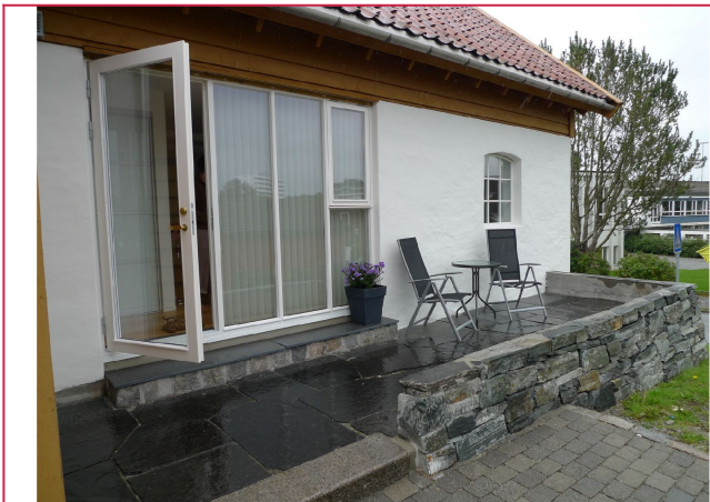
Eget uteområde, samt tilhørende parkeringsplass