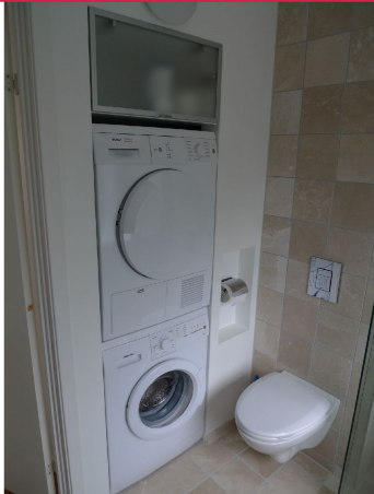
Vaskemaskin og tørketrommel medfølger