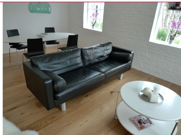
Leiligheten er møblert