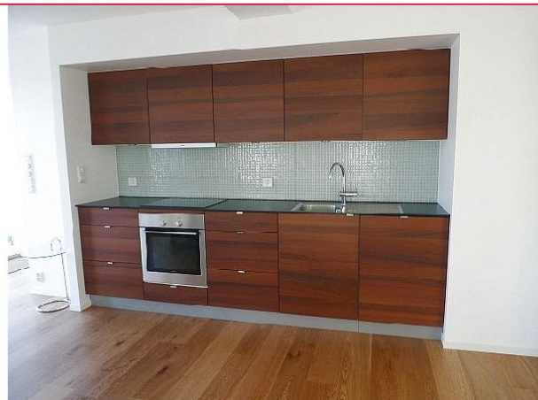
Kjøkkenet med integrerte hvitevarer