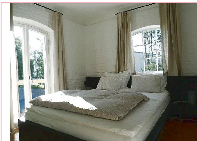
Soverom med luftbalkong