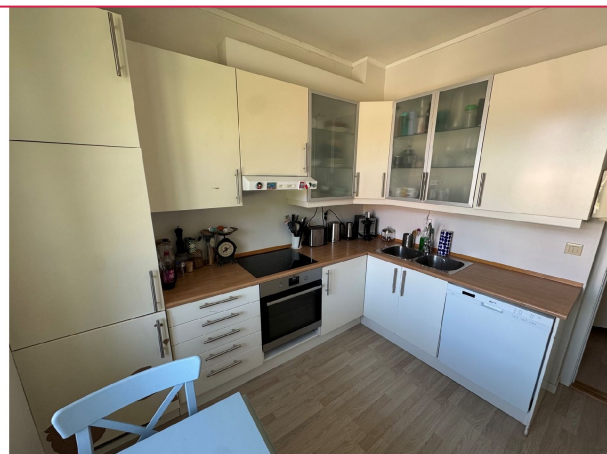
Godt med skap og benkeplass.