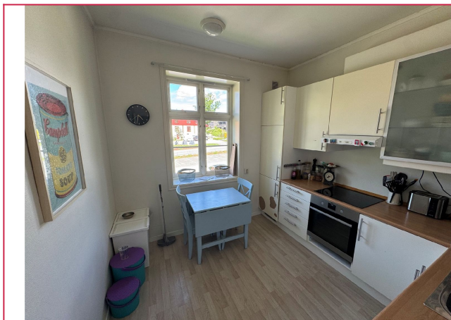
Separat kjøkken med plass til mindre spisebord.