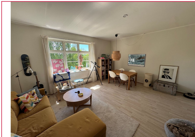
Store vinduer som sørger for naturlig lys.