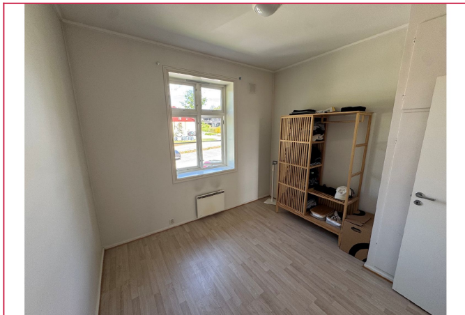
Soverom 2 har god plass til dobbeltseng.