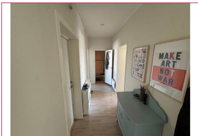
Romslig entre med god plass til å henge av seg tøy.