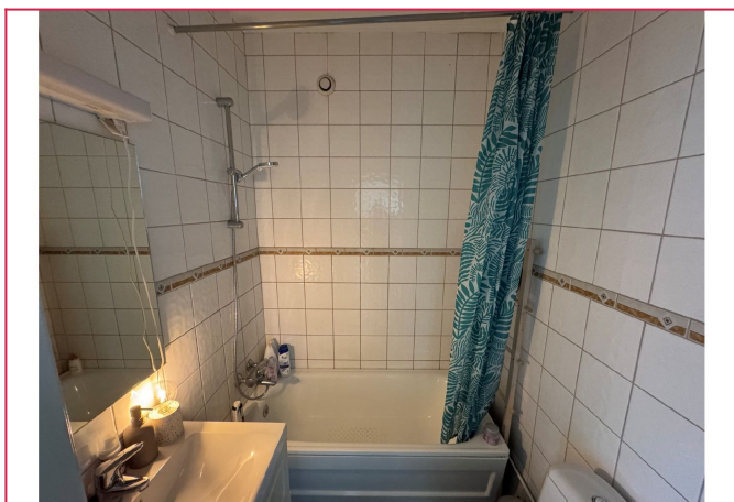
Flislagt bad med badekar.