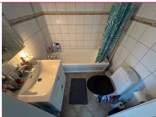
Fellesvaskeri i kjeller.