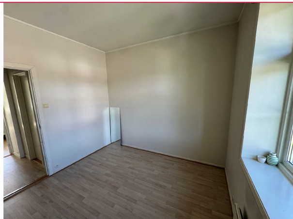
God plass til dobbeltseng.