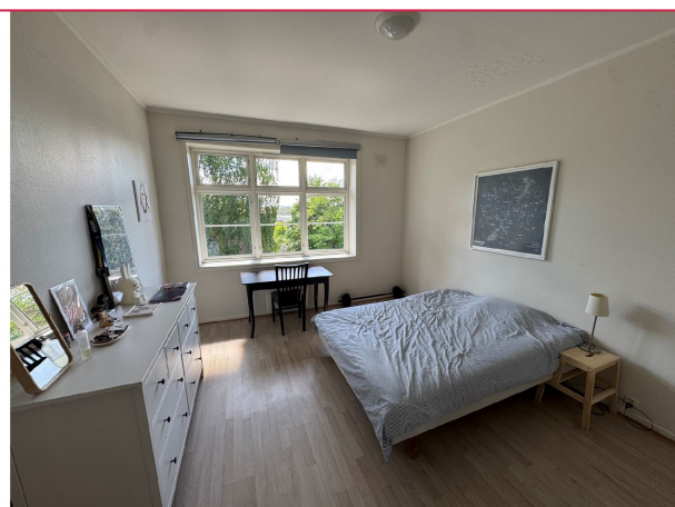
Store vinduer som sørger for naturlig lys.