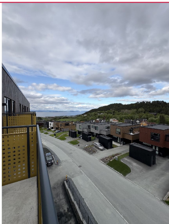
Boligen ligger i et rolig boområde! Parkering medfølger