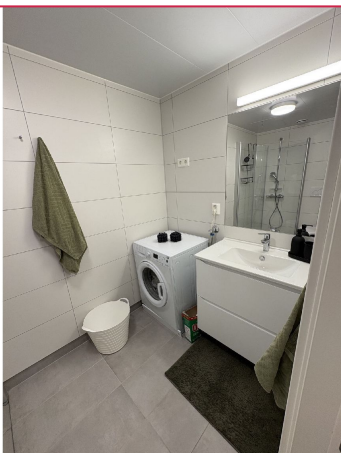
Lyst og pent bad med varmekabler i gulv