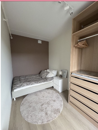
Hovedsoverommet er romslig med pax skap som medfølger