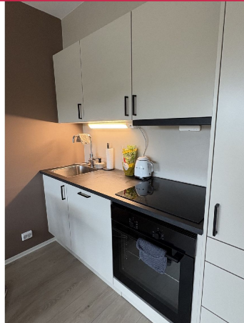
Lyst og pent kjøkken med integrerte hvitevarer