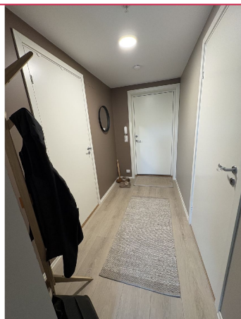
Romslig entrè med god plass til oppbevaring av yttertøy.