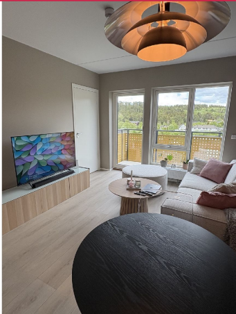
Leiligheten leies ut delvis møblert i henhold til liste - noe avvik fra hva bildene viser