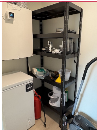
Bod er innredet med fryser og oppbevaringshylle