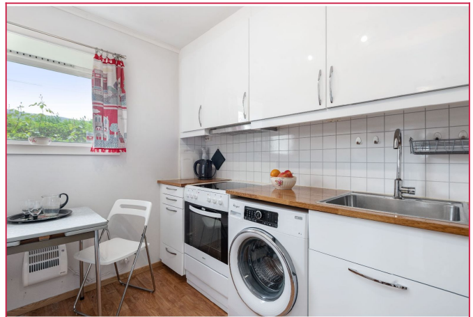
Kjøkken med komfyr og vaskemaskin