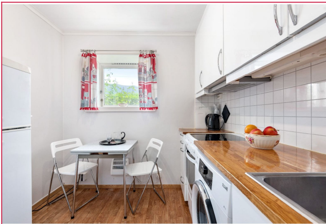
Kjøkken med spiseplass og integrerte hvitevarer