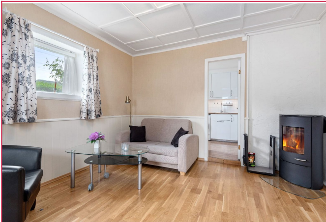
Stue med møbler og peis