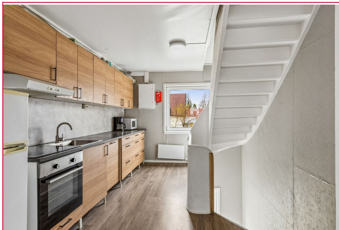
Kjøkken - Hvittevarer medfølger