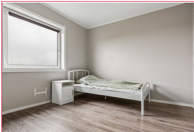
Soverom - Huset er nyere oppgradert