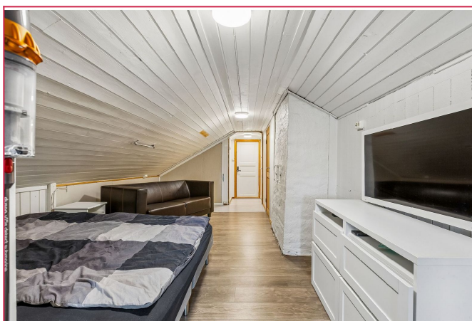
Loftstue - kan brukes som soverom eller stue