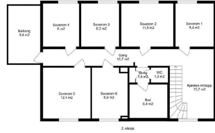
Hovedetasje - Plantegning