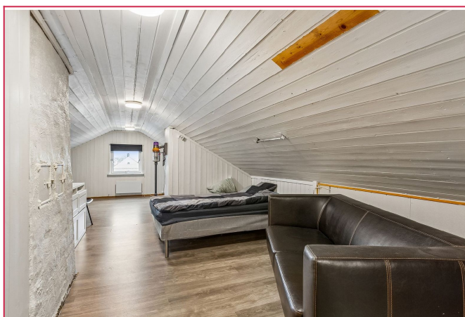
Her er det også WC og et ekstra rom