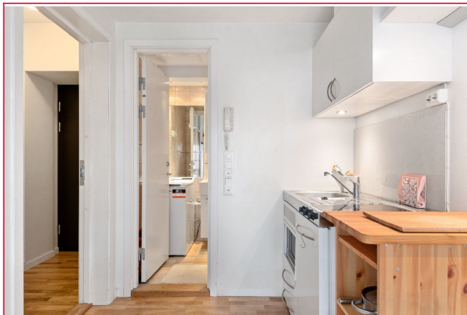
Hybelleiligheten består av kjøkken/soverom og badrom. Kjøkkenet fra bildet er skiftet ut.