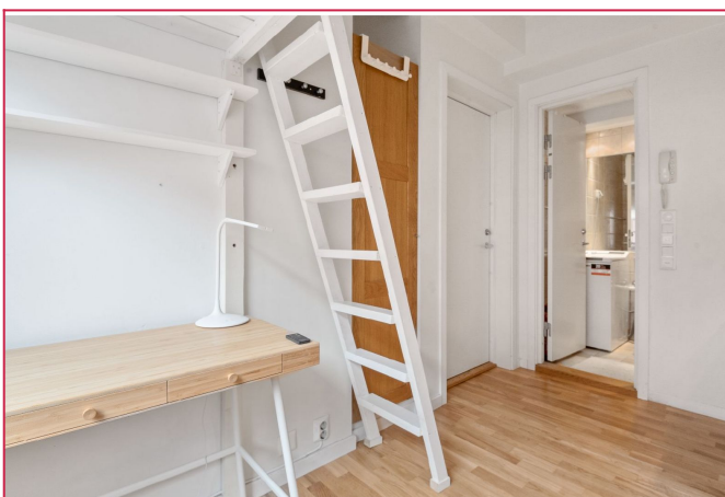
Bilde tatt fra under hemsen. Boligen har alt inkludert.