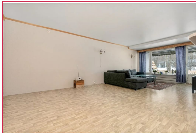
Stor og romslig stue med god plass til sofamøblement og spisebord.