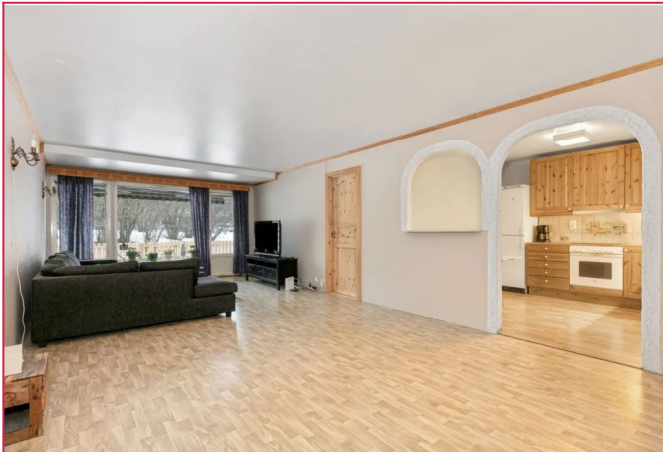
Delvis åpen stue- og kjøkkenløsning.