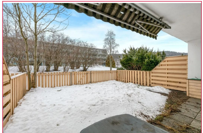
Hage - Det er markise og levegg mot naboene.