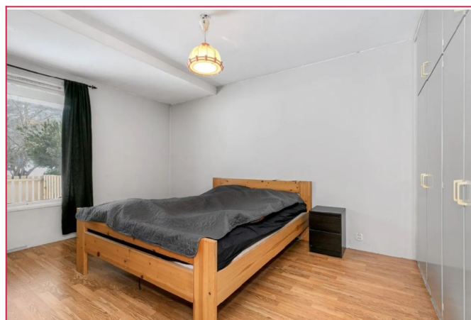
Soverommet har god plass til dobbeltseng og har plassbygde garderobeskap.