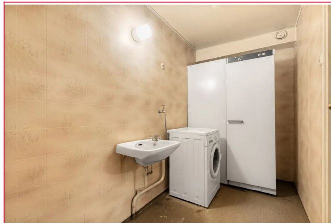
Vaskerom er utstyrt med utslagsvask, opplegg for vaskemaskin og tørkeskap.