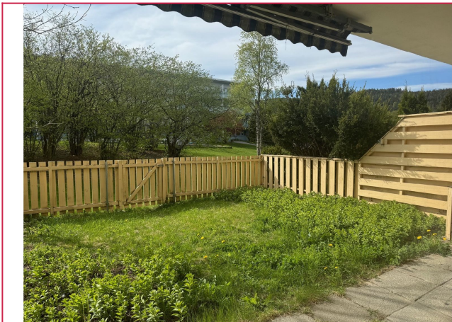
Vestvendt markterrasse/ hagedel på ca. 50 m 2