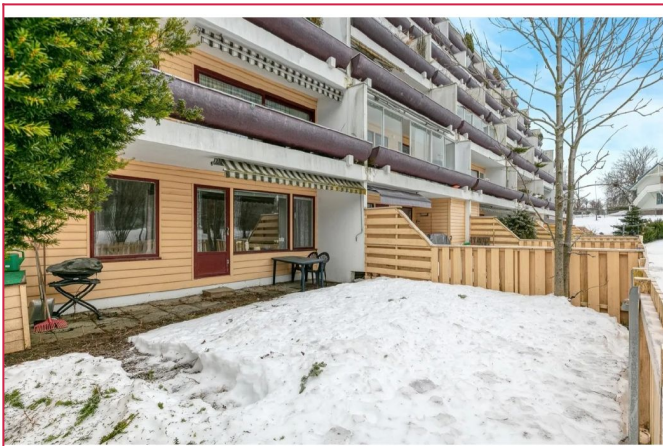
Hage - Lite område med betongheller og resten gressplen.