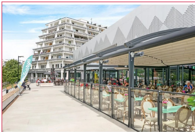
Stovner senter ligger i nærheten av leiligheten.