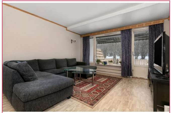
Utgang fra stuen til vestvendt markterrasse/ hagedel.