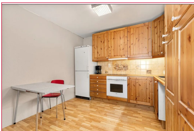
Kjøkken - plass til spisebord på kjøkkenet.