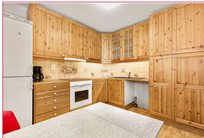
Godt med skap- og benk plass på kjøkkenet. Opplegg for oppvaskmaskin.