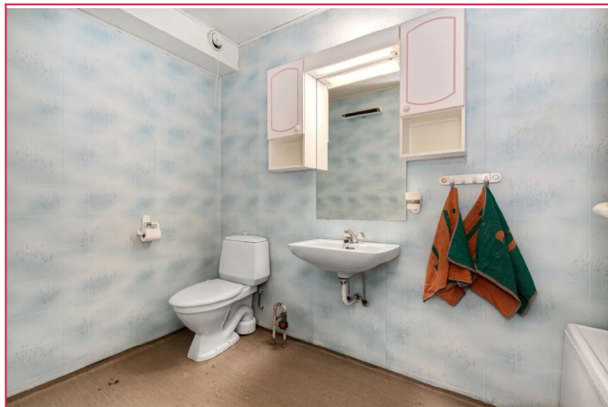
Bad er utstyrt med badekar, servant og toalett.