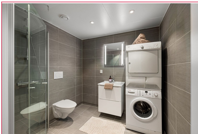
Lekker flislagt bad med gulvvarme og opplegg for vaskemaskin