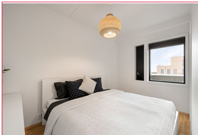
Soverommet er av god størrelse og har plass til klesoppbevaring og dobbeltseng