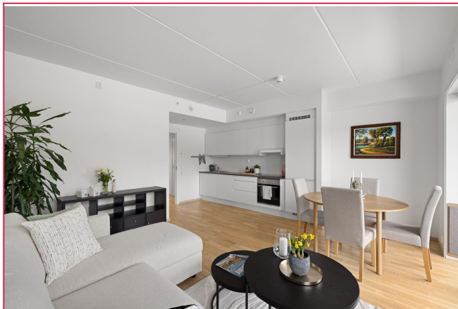
Stue og kjøkken i åpen løsning