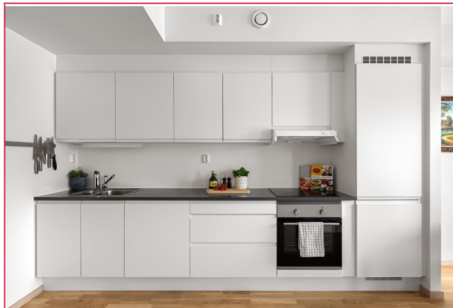
Kjøkken med integrerte hvitevarer og godt med benplass