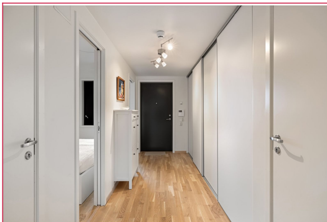
Velkommen inn! Entrén har lagringsplass bak skyvedører