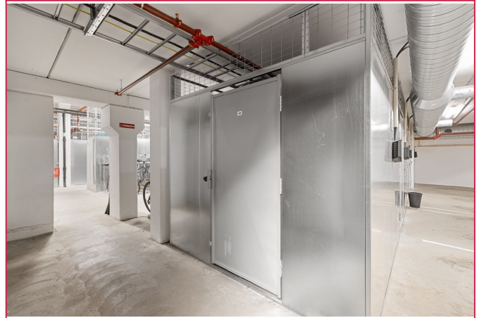
Det medfølger en romslig bod i garasjekjeller