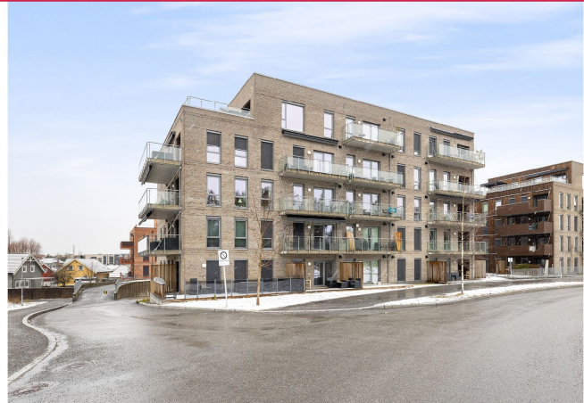
Velkommen til Fjellvegen 12! Boligen ligger i 3. etasje