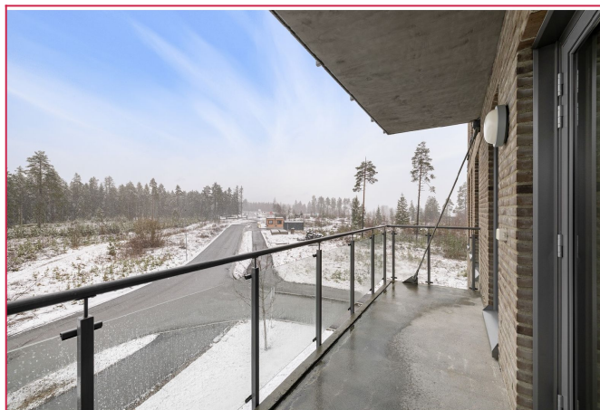
Stor overbygget balkong med hyggelig utsikt