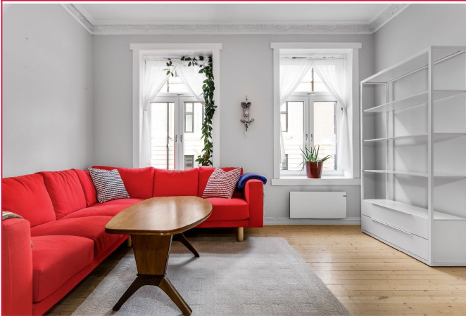
Stor stue med plass til sofa og spisesbord