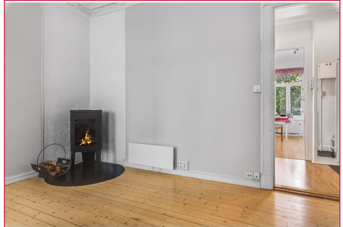
Stue med vedovn og plass til spisebord