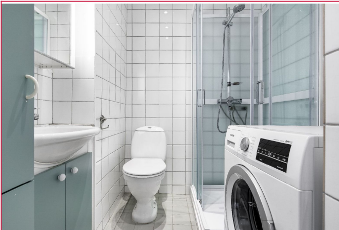
Bad med vaskemaskin