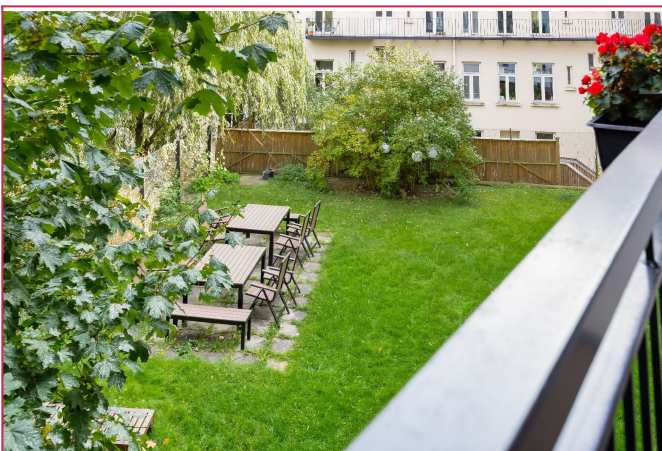
Flott bakhage med bord og stoler