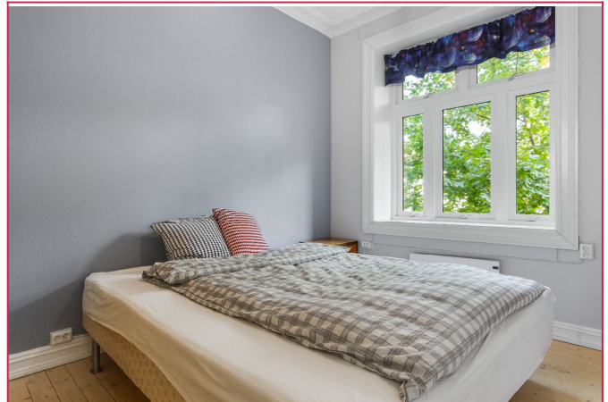
Soverom med god plass til seng og lagring