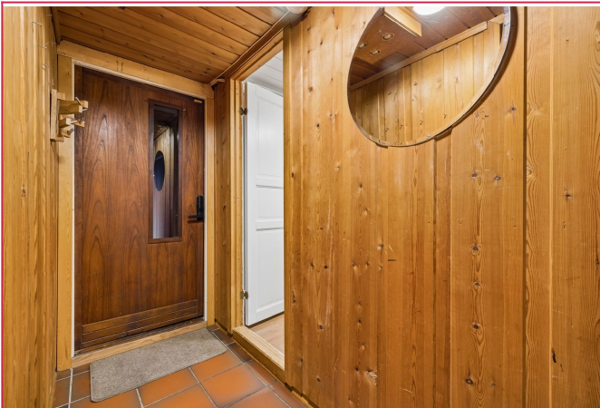
Entre med egen lås ut til felles gang