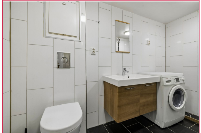
Pent flislagt bad