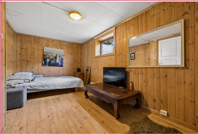
Dette rommet kan benyttes som stue, soverom eller begge deler.