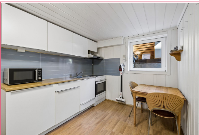
Kjøkkenet har det man trenger av vitevarer. Også et hyggelig spisebord