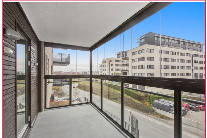
Romslig balkong med god plass til utemøbler