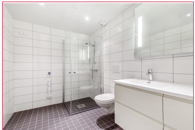
Pent flislagt bad