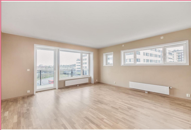
Stue med utgang til balkong