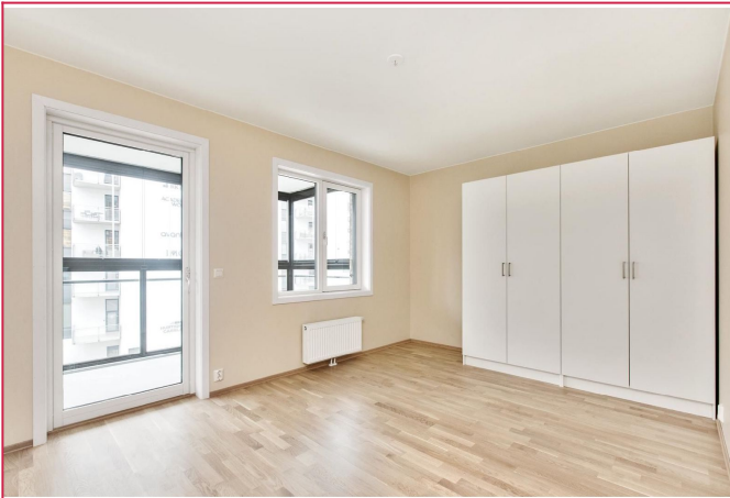
Soverom 1 med utgang til balkong