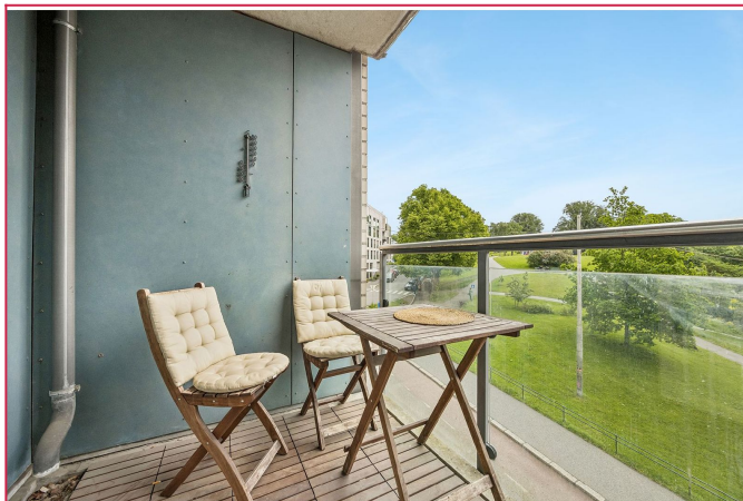
Balkong som vender mot Stensparken