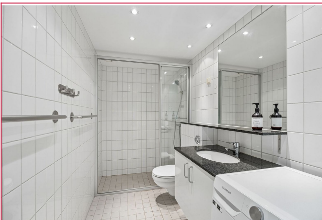
Pent bad med downlights. Opplegg vaskemaskin.