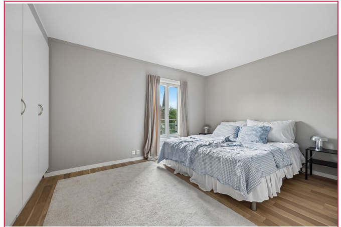
Romslig soverom med skap som følger.