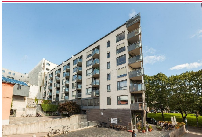
Fasade- inngang på samme side som Stensparken