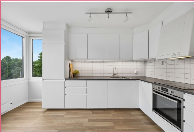
Kjøkken med hvitevarer