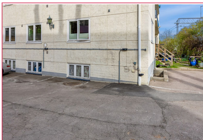
Parkering kan leies i tillegg til husleien.