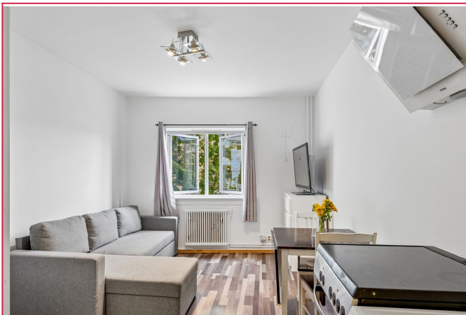
Leiligheten er nymalt.