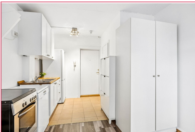
Det er både garderobeskap og skoskap.