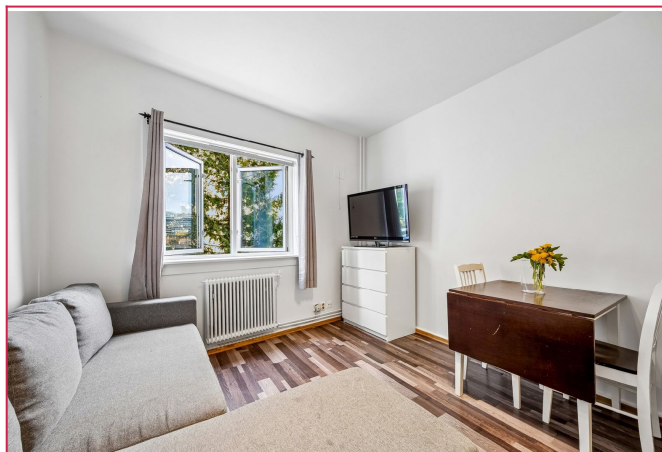
Leiligheten kan leies delvis møblert eller umøblert.