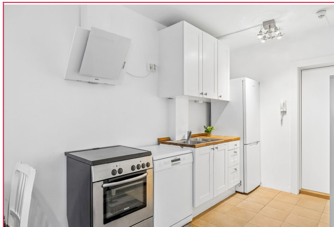
Pent kjøkken med alt av hvitevarer.