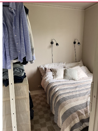
Soverom med plass til dobbelseng.