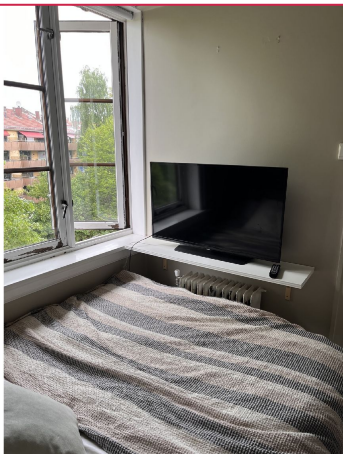
God belysning fra vindu.