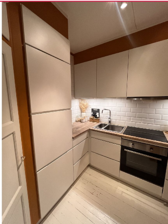
Kjøkken inkluderer hvitevarer.