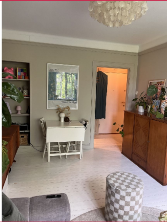
Romslig stue med plass til forskjellige sittegrupper.