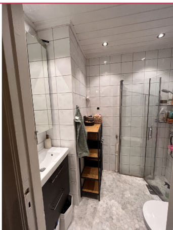
Flislagt baderom med opplegg for vaskemaskin.