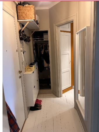
Entré med innebygget garderobeskap.