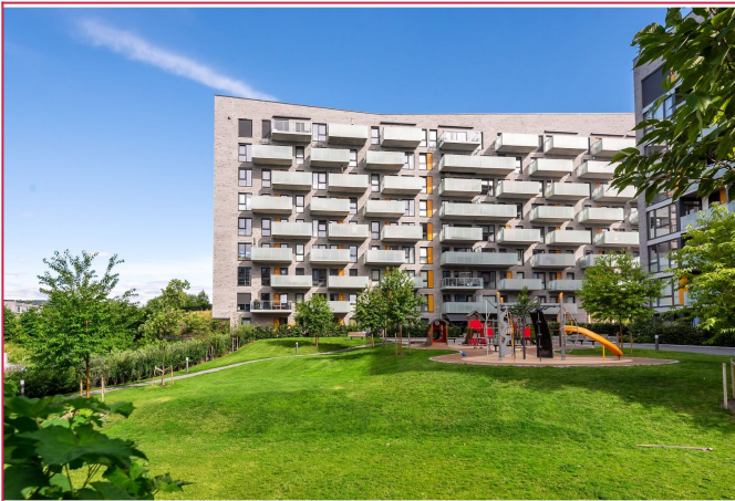
Velkommen til Fernanda Nissens Gate 3 A!