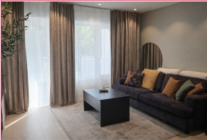
Direkte inngang til lys og åpen stue - kjøkkenløsning