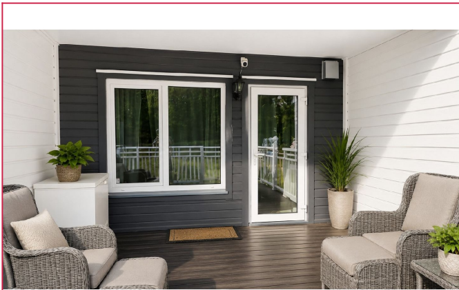
Fint inngangsparti med gode solforhold