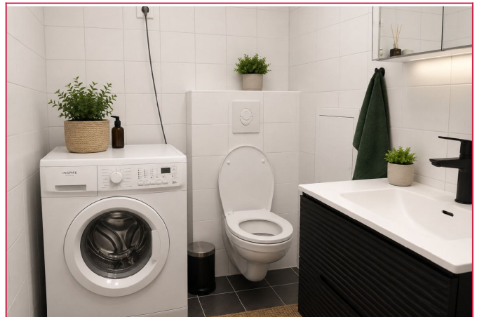
Pent flislagt bad