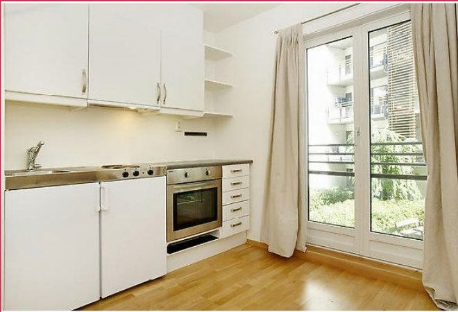
Lyst og funksjonelt kjøkken