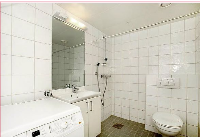
Pent flislagt bad med servant m/underskap, dusj, vegghengt wc, opplegg for vaskemaskin, varme i gulv