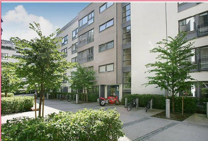
Velkommen til Pilestredet Park 39