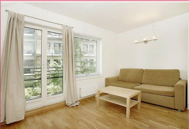
Stue med utgang til fransk balkong