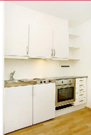
På kjøkkenet er det god skaplass