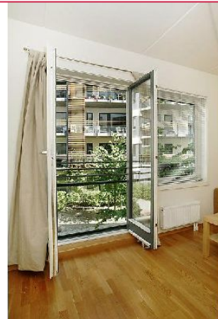
Fransk balkong mellom kjøkken og stue