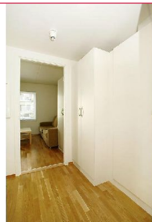
Entrè med garderobeskap