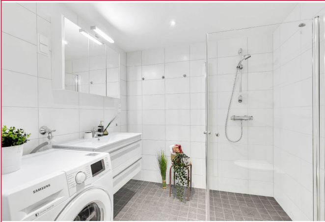
Pent bad med varme i gulv