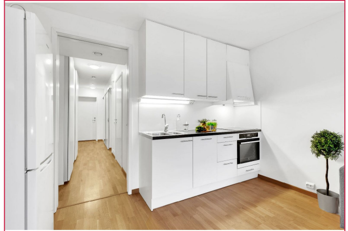
Kjøkkenen med oppvaskmaskin og komfyr. God skapplass.