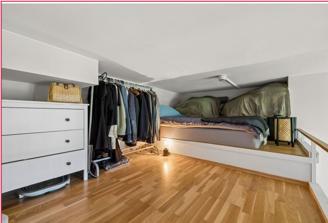
Plass til oppbevaring på hemsen