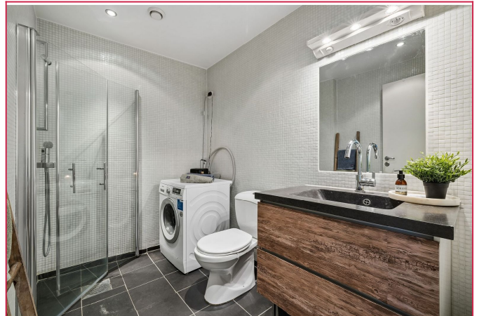
Pent flislagt bad med varmekabler. Vaskemaskin medfølger