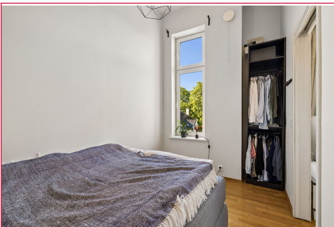
Lyst og romslig soverom med plass til dobbeltseng