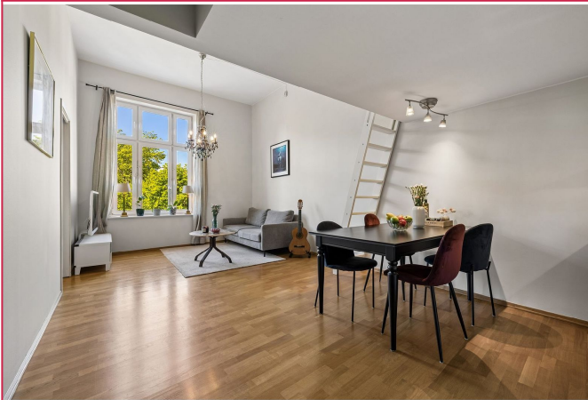
Innbydende stue med gode møbleringsmuligheter