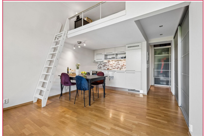
Lekker kjøkken med integrerte hvitevarer