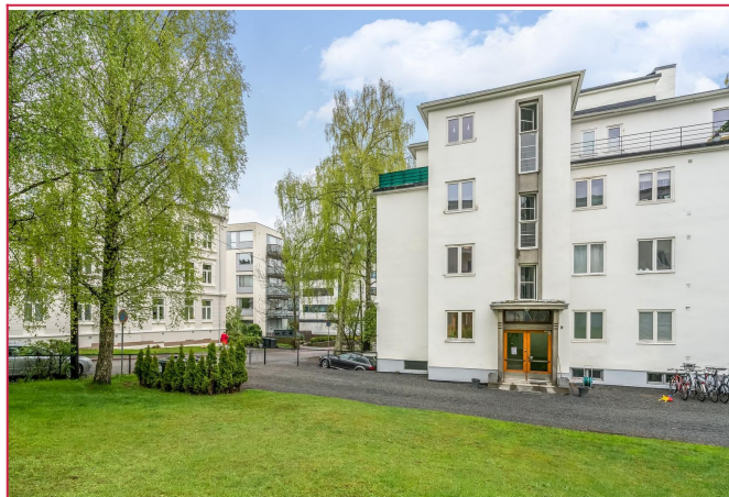
Fasade med pent opparbeidet uteareal. Eiendommen er inngjerdet.