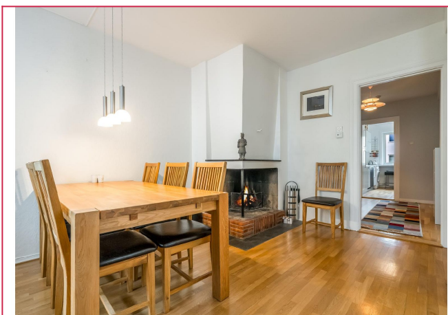
Spisestue med peis og utgang til balkong.