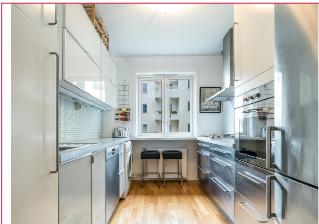
Pent kjøkken med hvitevarer inkl. Komfyrtopp med gass. Praktisk brukskjøkken!