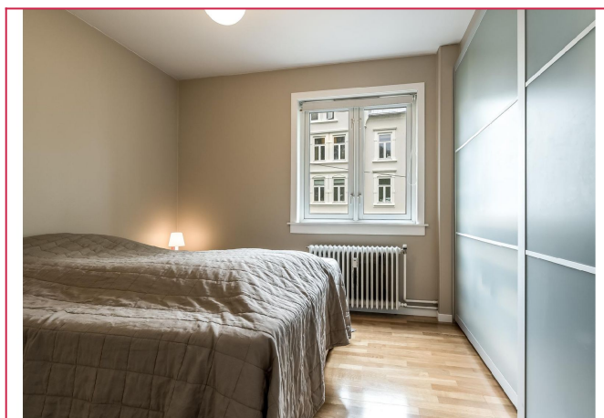
Hovedsoverom med stor skyvedørgarderobe. Plass til 180 seng. Seng på bilde følger.