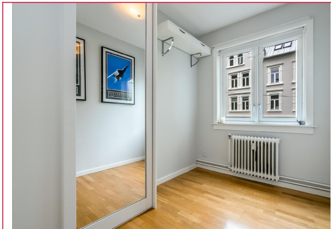
Soverom 2 med skyvedørsgarderobe. Brukes i dag som kontor. Fint gjesterom!