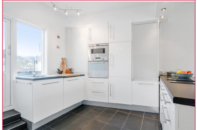
Kjøkkenet - Godt med benk og skaplass - Hvitevarer følger med i leien