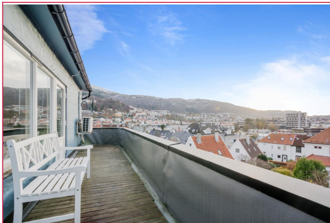
Utsikt fra balkong