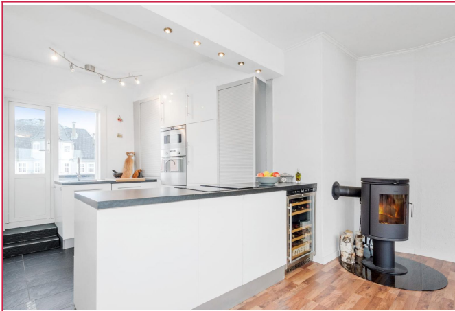
Det er utgang til balkong fra kjøkkenet - Leiligheten har 2 balkonger