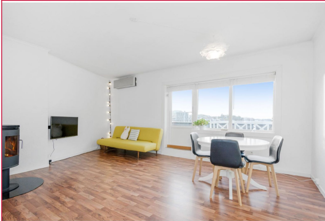
Stuen har peis, varmepumpe og utgang til balkong