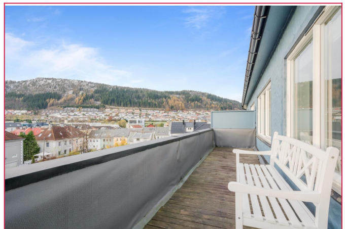
Leiligheten har 2 balkonger med flott utsikt og gode solforhold