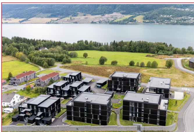
Umiddelbar nærhet til populære turområder like nedenfor og langs Mjøsa.