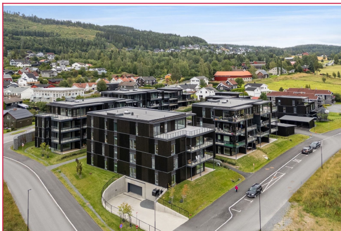
Det er godt med parkeringmuligheter rundt og inne på området.