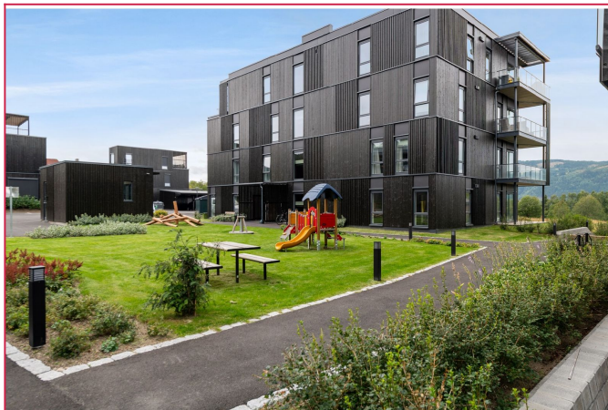
Flotte og grønne områder som blir opplyst i lunt lys om kvelden.