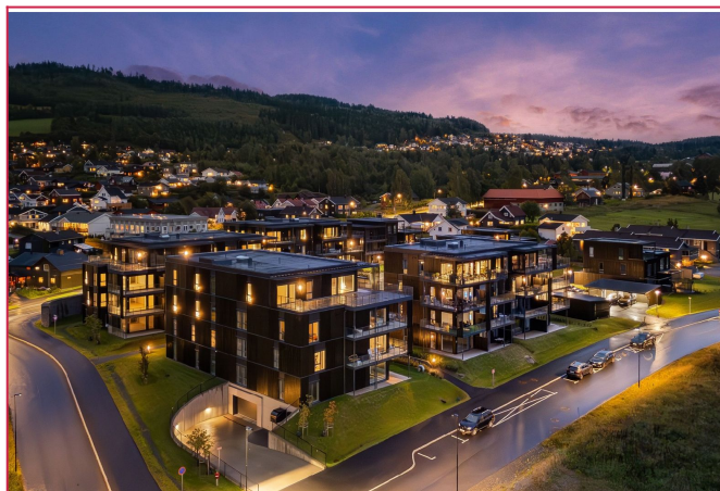
Blir god stemning med varme lys og godt opplyste gater.