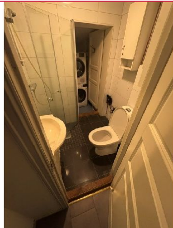
Bad med vaskerom