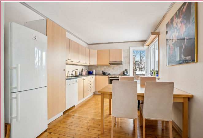
Stort kjøkken med frittstående hvitevarer.