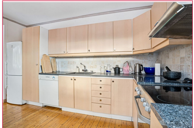
Kjøkkenet har godt med oppbevaringsplass i skuffer og skap.