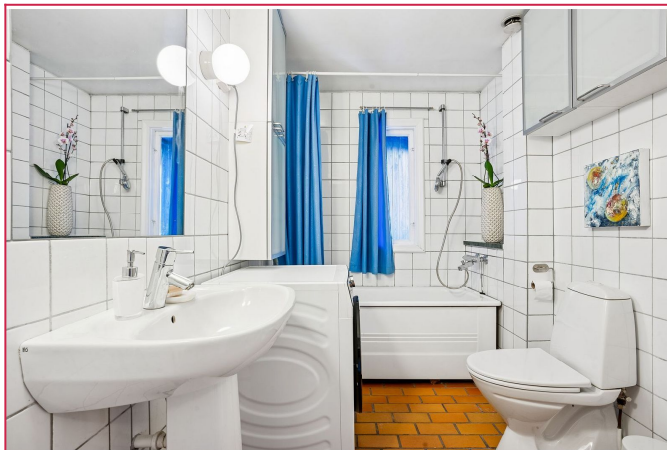
Lyst og flislagt bad med vaskemaskin.