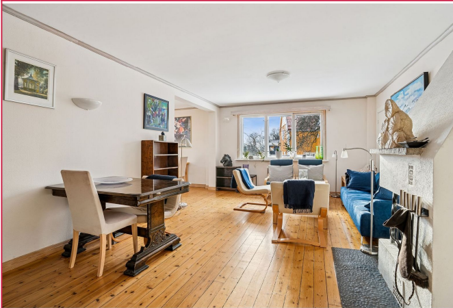
Stuen er svært romslig og er innredet med sofagruppe og spisebord.