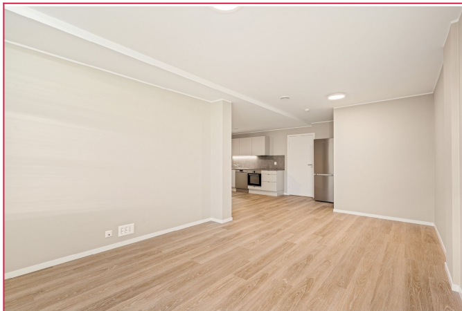
Velkommen til Torgallmenningen 3 A!