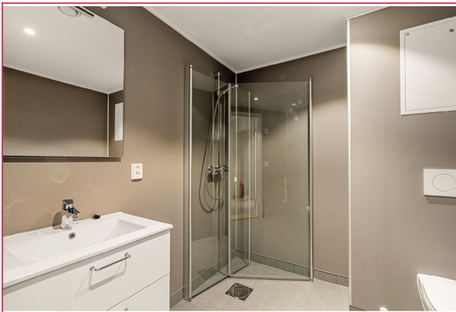
På badet er det opplegg for vaskemaskin, men selve vaskemaskin må skaffes selv.