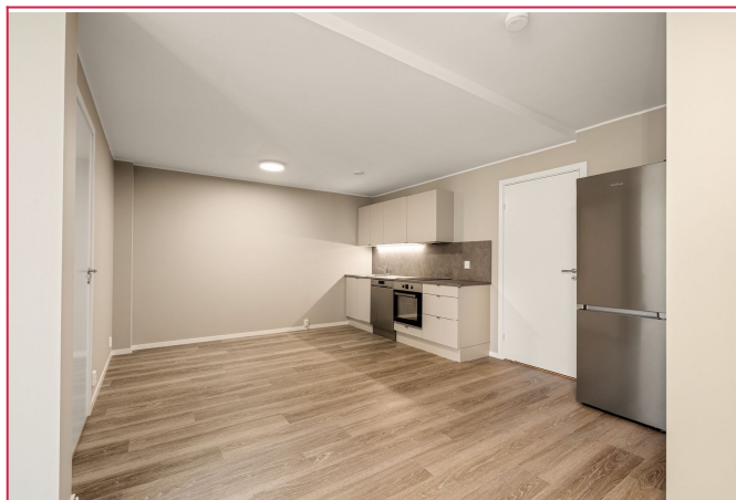
Kjøkken kommer med hvitevarer.