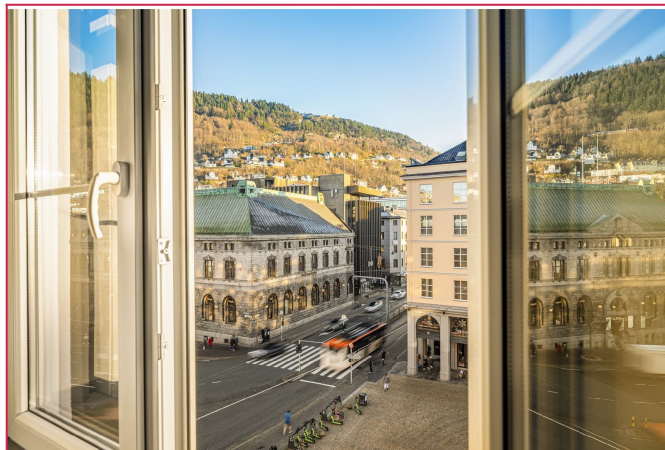
Nydelig utsikt over Torgallmenningen, ned mot bryggen og opp mot Fløyen!