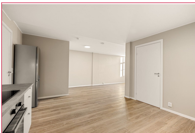
Fra Kjøkken/stue finner man dør til soverommet