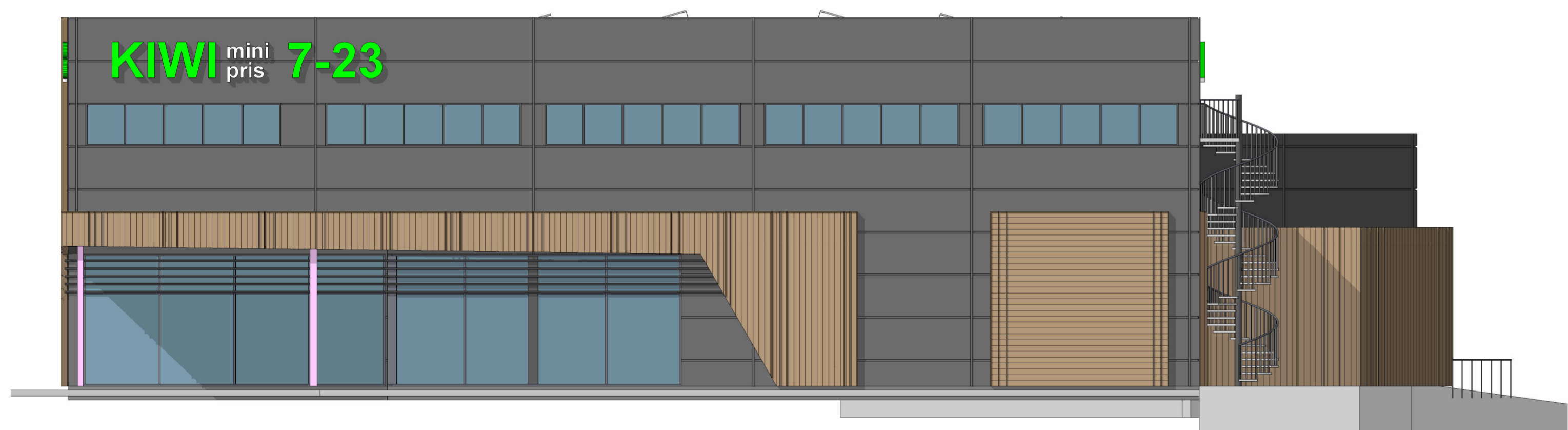
3 Vest 1 : 100