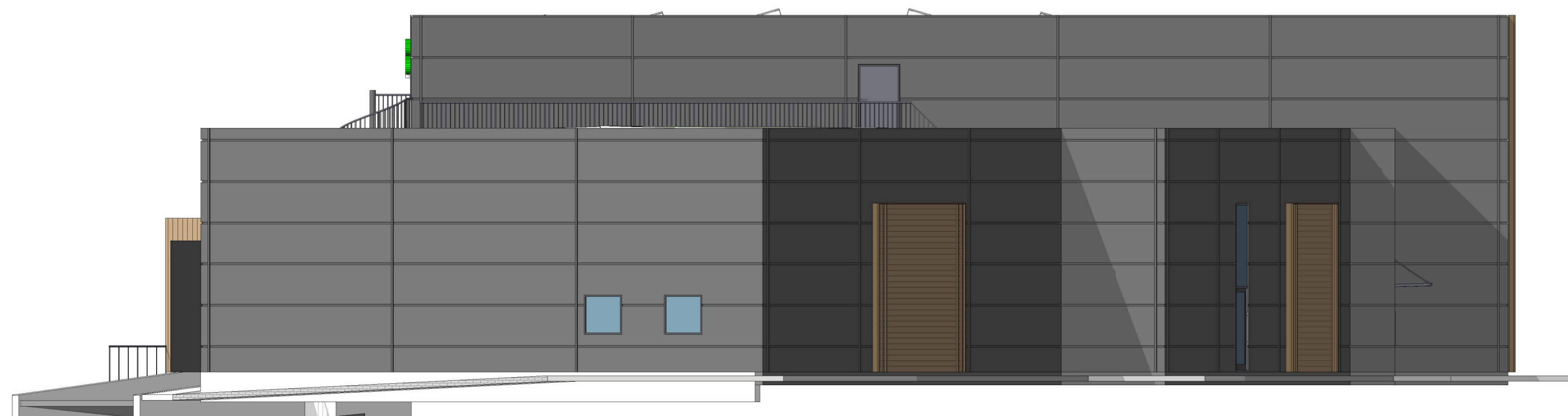
4 Øst 1 : 100