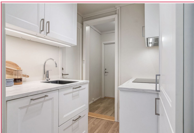
Det er god skaplass og full størrelse på hvitevarer.