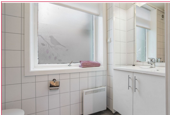
Badet holder god standard og har servant, speil, toalett og dusj. Vaskemaskin er på eget rom ved bod