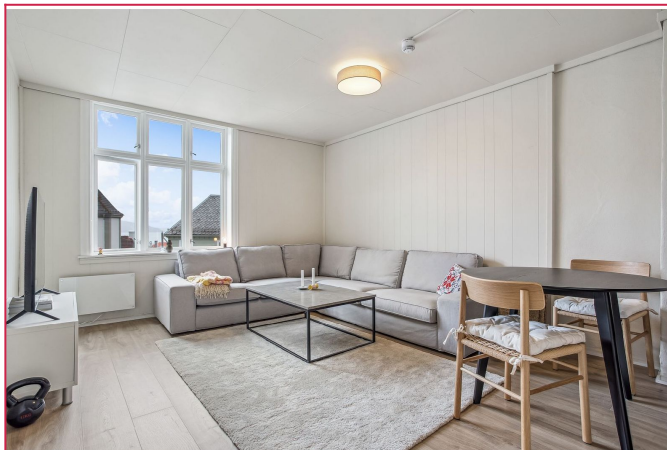
Stuen er romslig og her kan man sitte å se på byfjorden fra private omgivelser.