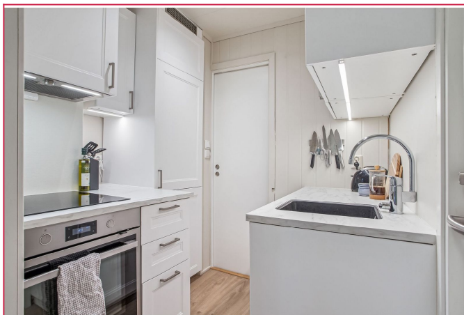
Kjøkkenet er godt utnyttet og inneholder alt man trenger på et kjøkken.