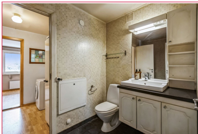
Bad med toalett, vask med underskap, badekar og speil.