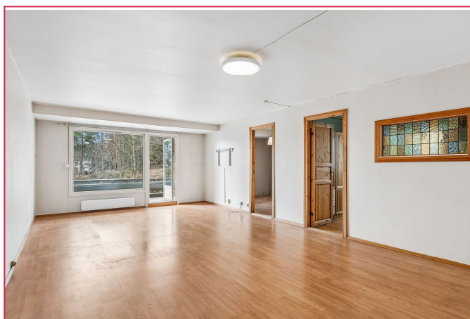
Lys og romslig stue med god plass til sittegruppe og spisegruppe.