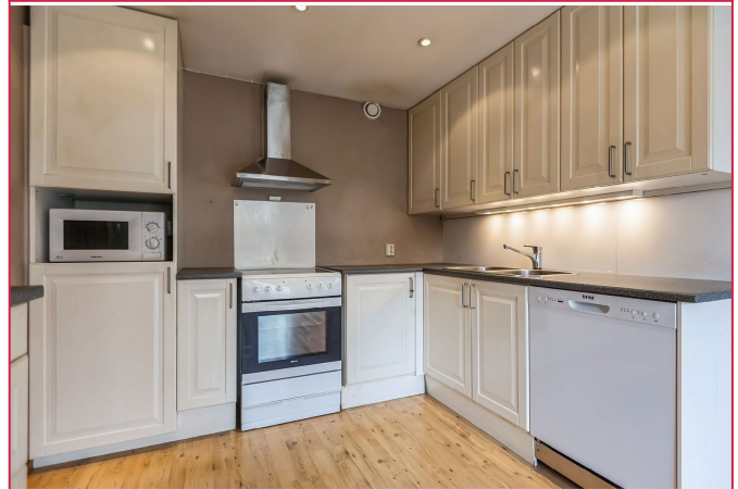
Kombiskap, oppvaskmaskin, komfyr med koketopp og mikrobølgeovn følger med.