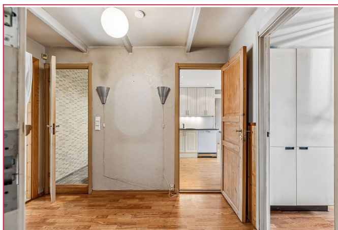
Lys og romslig entre.