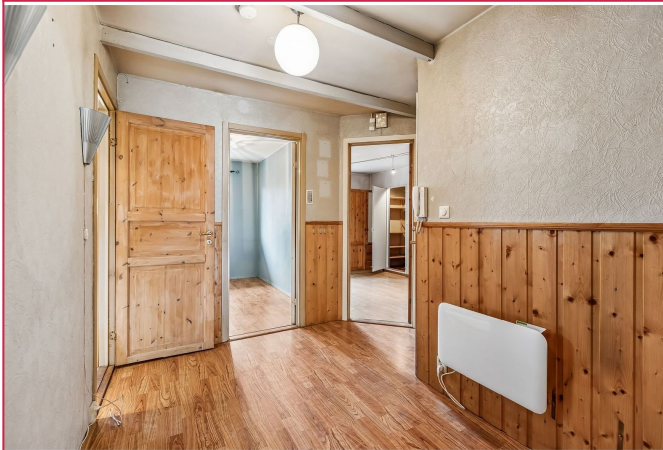
Entre med tilgang til 2 soverom.