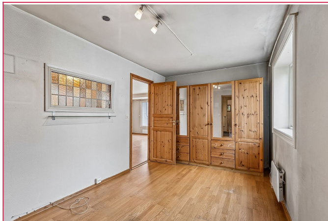
Lyst og romslig soverom med plass til dobbeltseng.