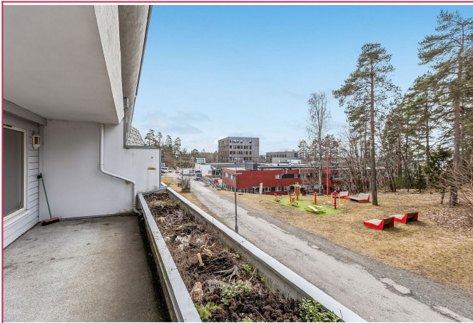
Velkommen til visning.