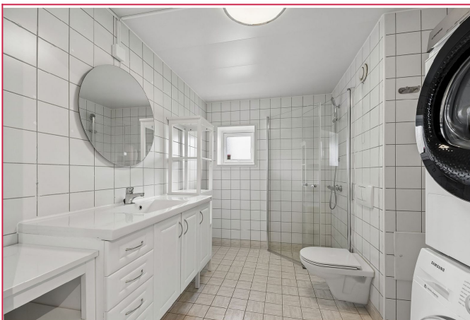
Bad med vaskesøyle og dusjhjørne