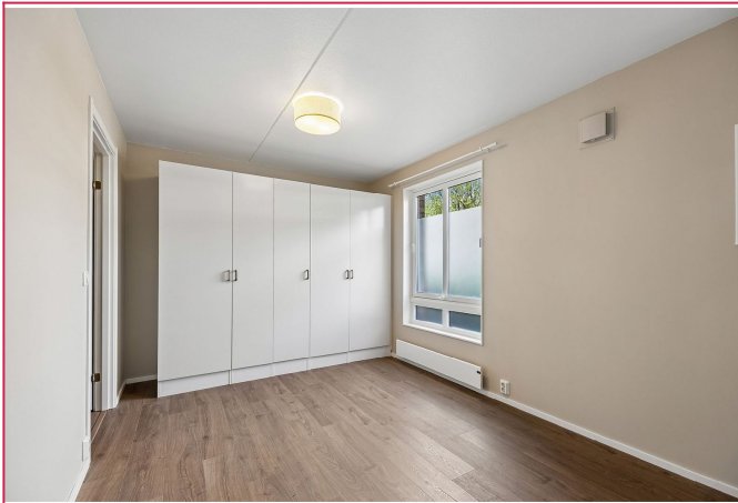
Stort soverom med garderobeskap