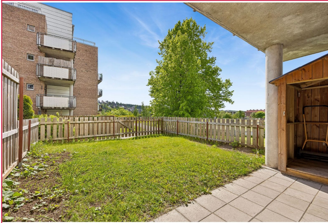
Egen privat liten hageflekk