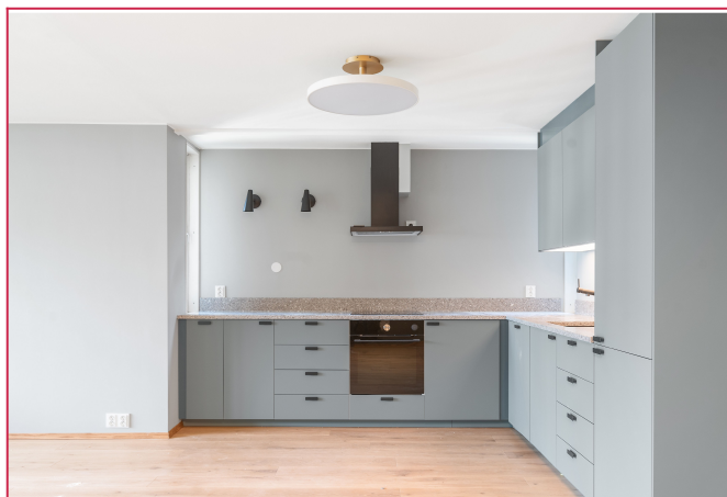
Kjøkkenet har integrerte hvitevarer. Det er satt inn en kjøkkenøy etter at bildene ble tatt.