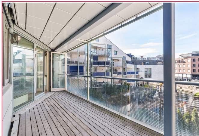
Balkong med gode solforhold.