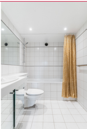
Bad 2 med inngang fra det ene soverommet.