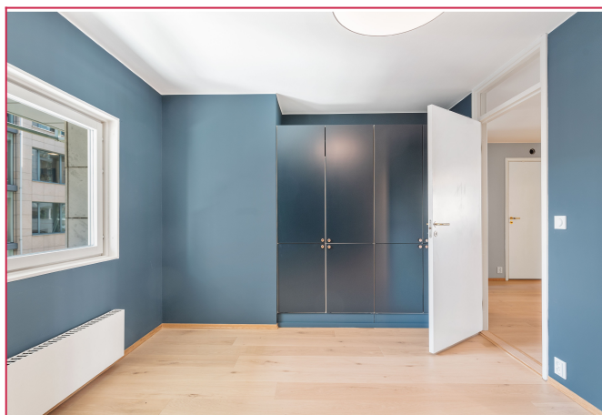
Romslig soverom med tilhørende bad.