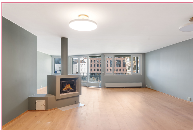
Stor og lekker stue med utgang til balkong.