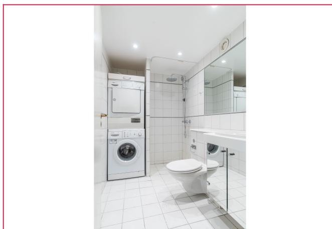
Hovedbad. Vask/tørk medfølger.