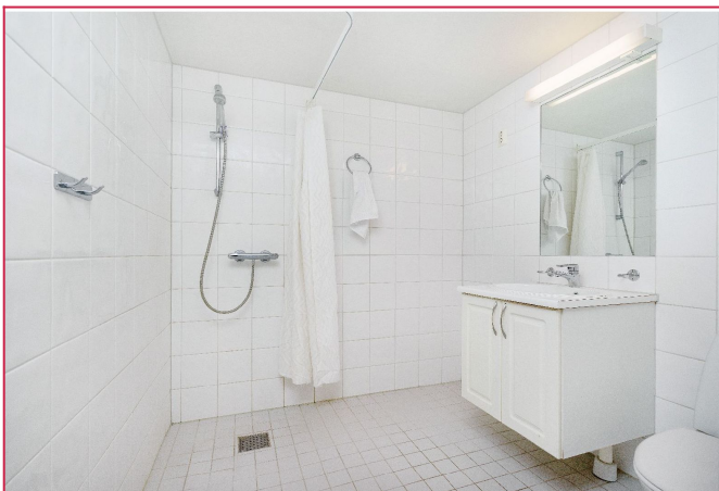
Flislagt bad med varmekabler i gulvet