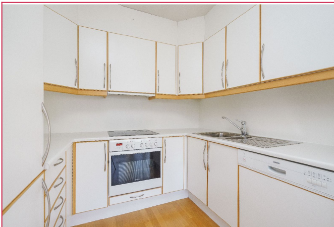
Kjøkken - integert kombiskap, stekeovn og oppvaskmaskin