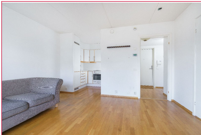
Stue mot kjøkken - Leiligheten har sentralfyring og varmt vann inkludert