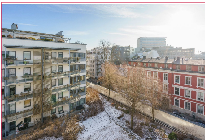
Utsikt fra fransk balkong