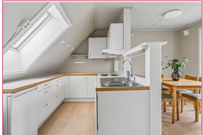
Romslig kjøkken med god benk- og skaplass.