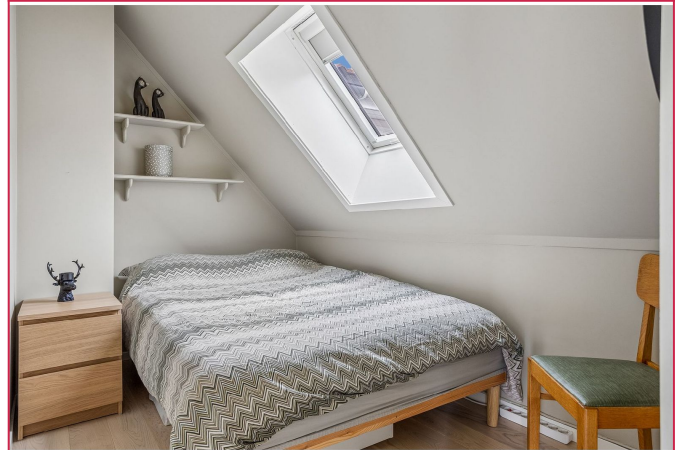
Disponibelt rom, brukes i dag som soverom.