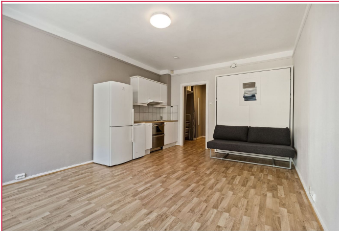
oppholdsrom/kjøkken (her er skapsengen lukket)