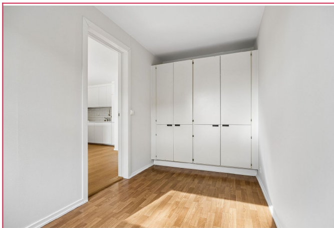
Soverom med garderobeskap.