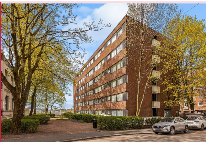
Fasade- gate parkering