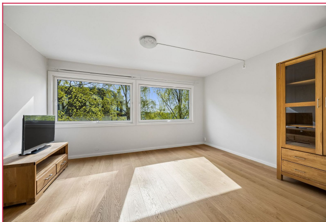
Stue- vitrineskap, tv bank og TV følger.