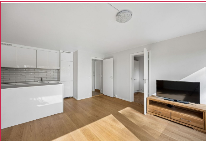
Stue med åpen kjøkkenløsning