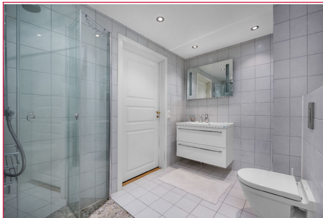
Lekker flislagt bad med servant, toalett, dusj og vaskesøyle