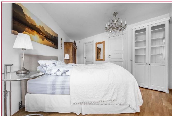
Stort soverom med walk-in-closet/bod og inngang til badet