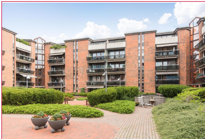
Koselig, velholdt bakgård