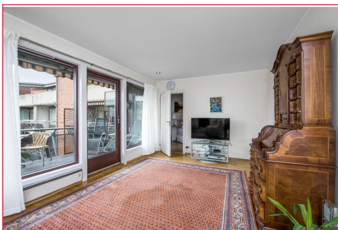
Lys og luftig stue med utgang til balkong