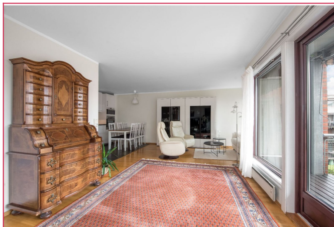
Åpen stue- og kjøkkenløsning