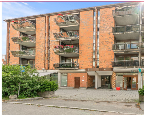
Fasade og inngangsparti