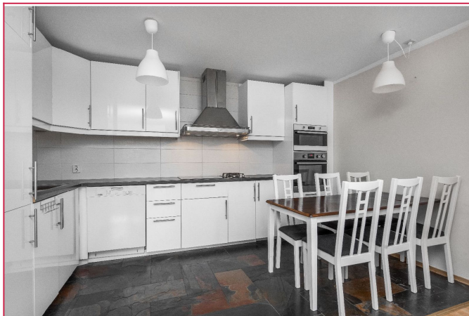
Kjøkkenet har glatte fronter og mye skap- og benkeplass

SAKSNUMMER 51445 - GARDEVEIEN 17, 0363 OSLO