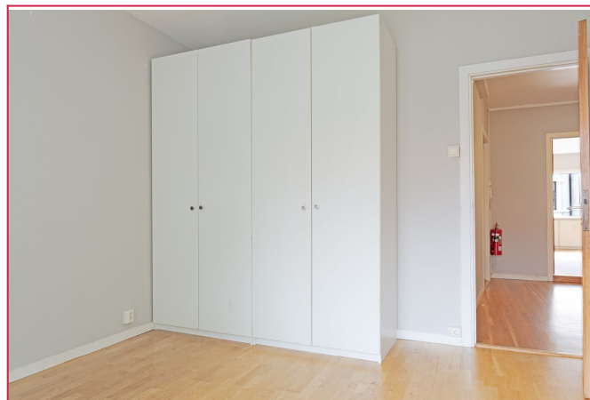
Sov 1 - Skjermet soverom mot rolig bakgård med god skaplass