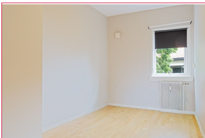
Sov 2 - Lyst soverom mot rolig bakgård med garderobeskap og plass til dobbeltseng.