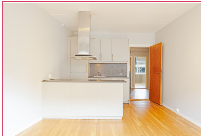
Lys og innbydende stue med åpen kjøkkenløsning og utgang til solrik balkong.