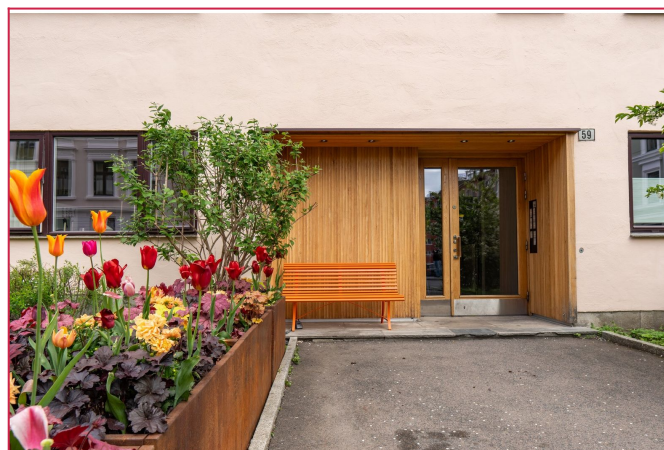
Velkommen til visning!