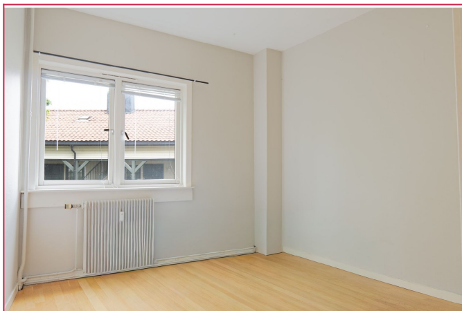
Sov 1 - Romslig soverom vendt mot stille bakgård med plass til dobbeltseng.