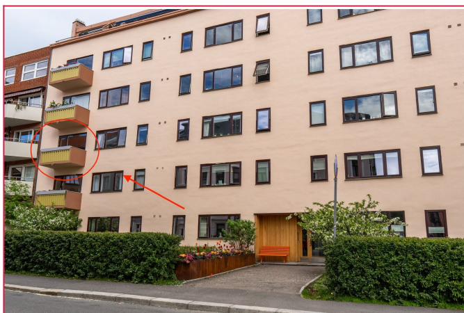
Leiligheten ligger i 3 etasje.