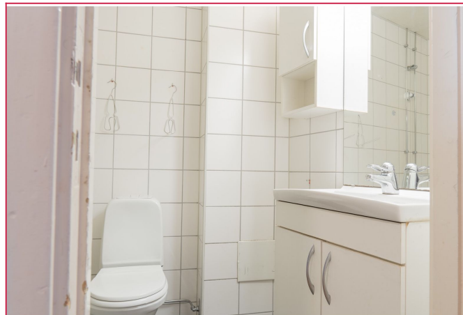
opplegg til vaskemaskin under vasken.