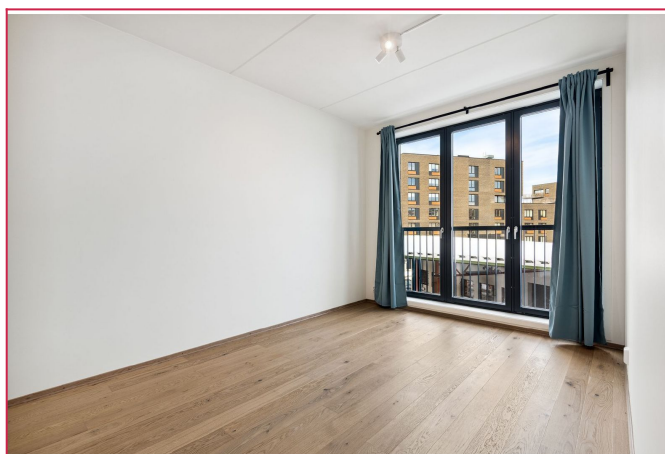
Hovedsoverom med tilgang til eget bad