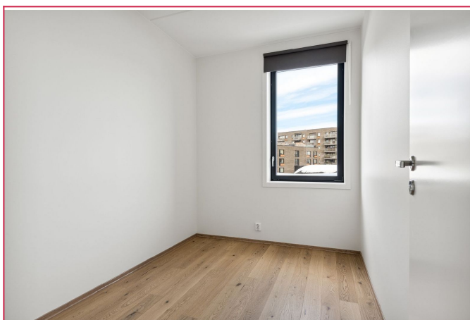
Soverom, det er et rom til som er identisk med dette