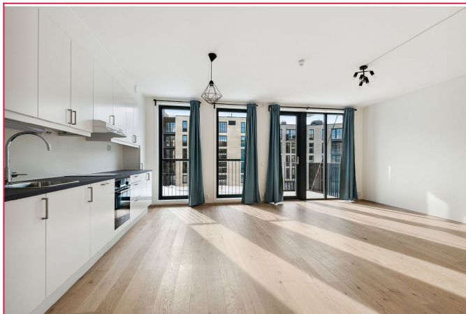
Romslig og lys stue med utgang til bakong