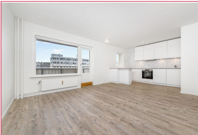
Stue med utgang til balkong