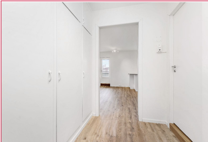
Lys entré med mye skaplass