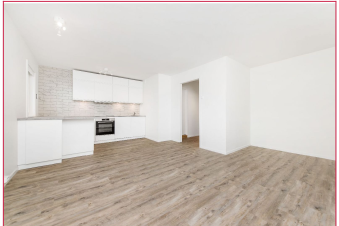
Romslig stue malt i lyse farger.