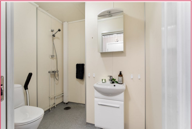
Baderommet er av fin størrelse. Taket på bad er malt etter at bildet er tatt.