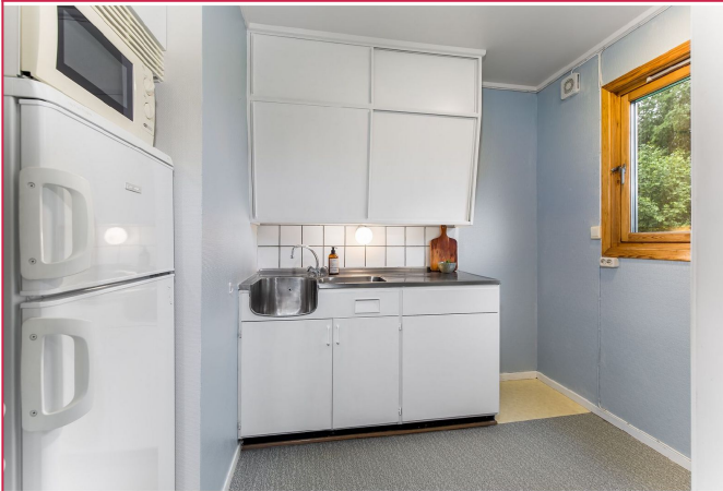
Kjøkkeninnredningen er enkel, men plass til det man trenger. Det er satt inn vifte og helt ny komfyr