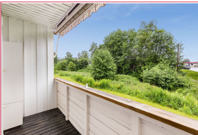
Hyggelig balkong med markise