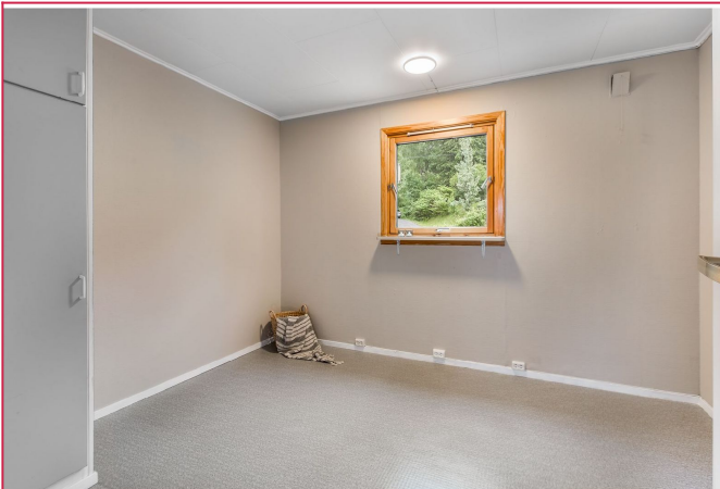
Stort soverom med innebygde og frittstående garderobeskap