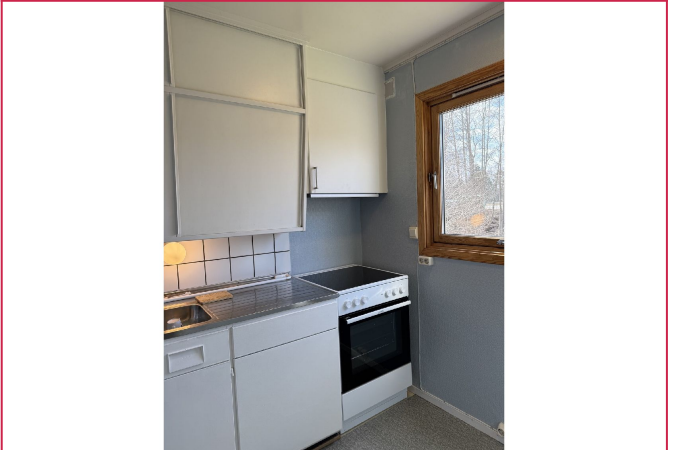
Helt ny komfyr og avtrekk er satt inn, og ekstra skap for lagring.