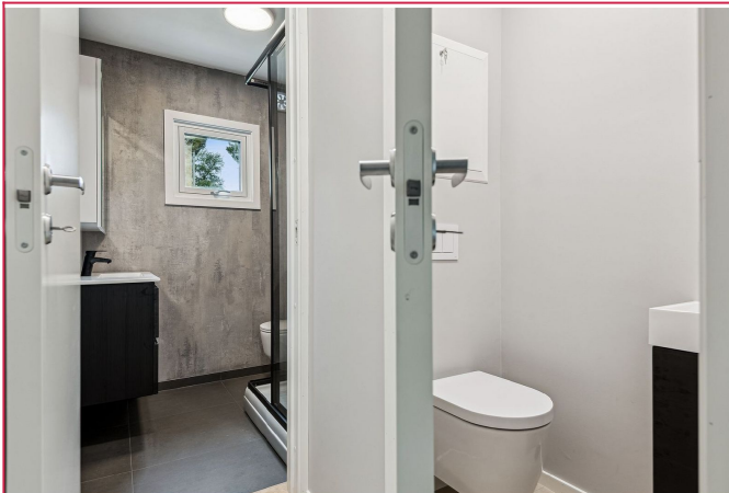
Leiligheten har et separat toalettrom.