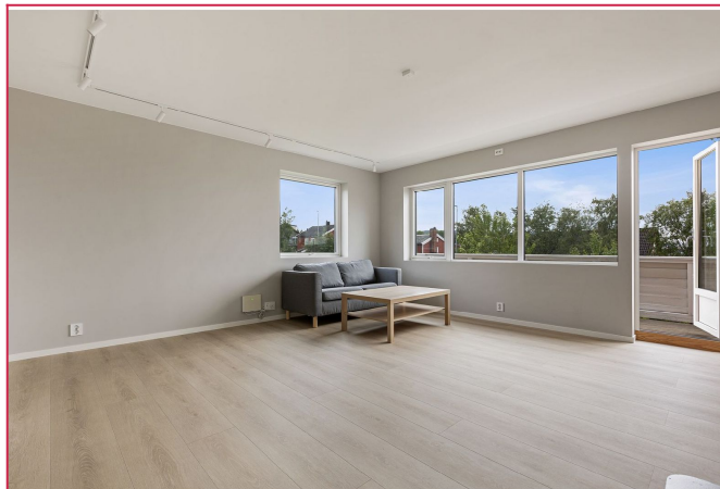
Leiligheten ble i sin helhet oppusset i 2025. Leiligheten har en praktisk planløsning.