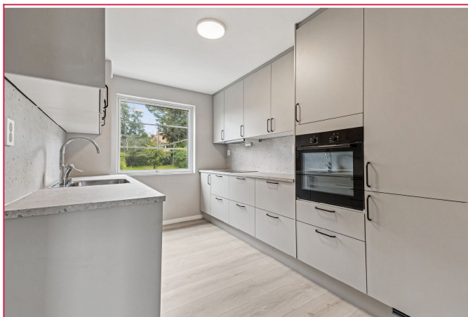
Pent kjøkken med integrerte hvitevarer som stekeovn, platetopp, kombiskap og oppvaskmaskin.