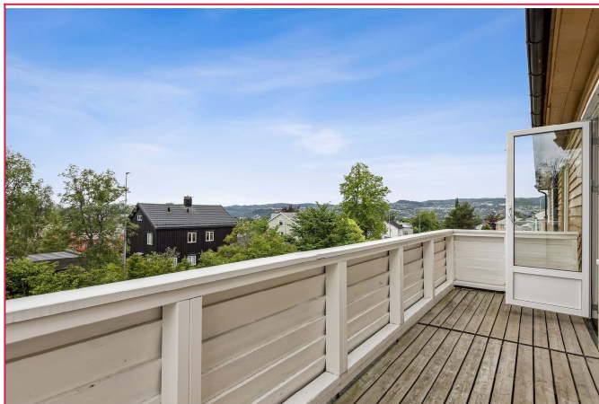
Fra stuen har man tilgang til en sørvendt balkong, med en vakker utsikt og svært gode solforhold.