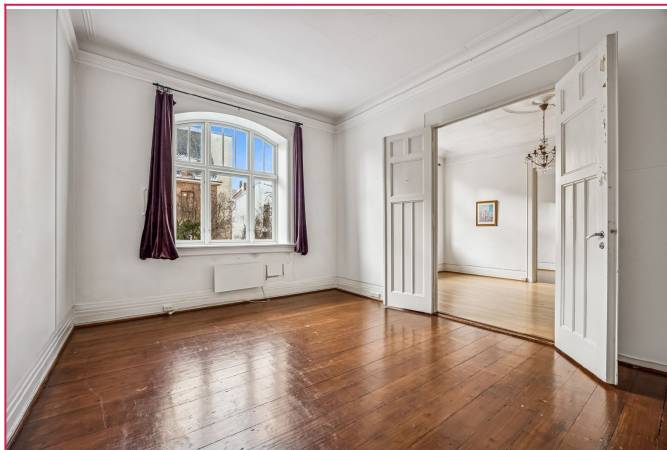
Lyse og luftige rom.