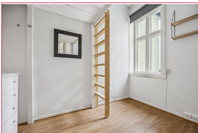
Ett av tre soverom. Plass til seng på gulvet.