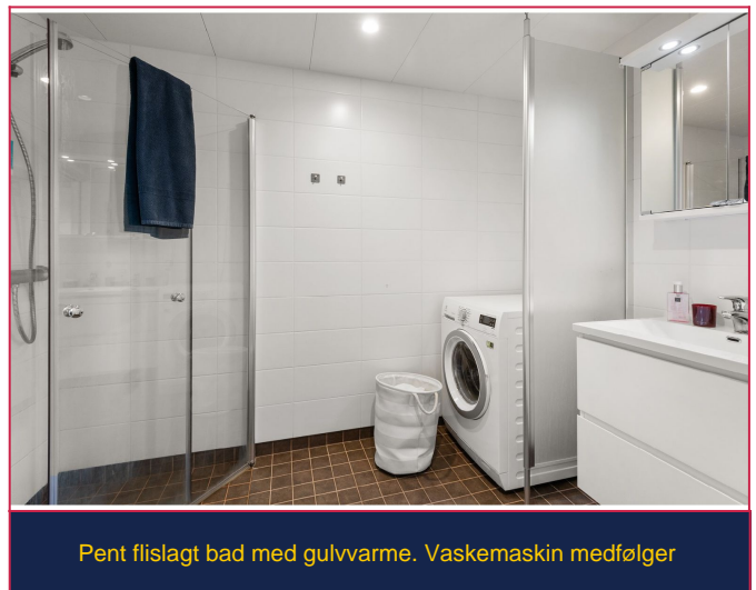
Pent flislagt bad med gulvvarme. Vaskemaskin medfølger