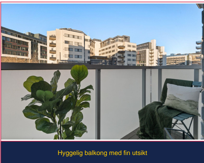
Hyggelig balkong med fin utsikt