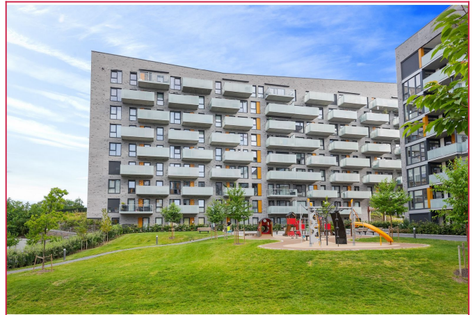
Området er pent opparbeidet med grønarealer, lekeplass og sittegrupper