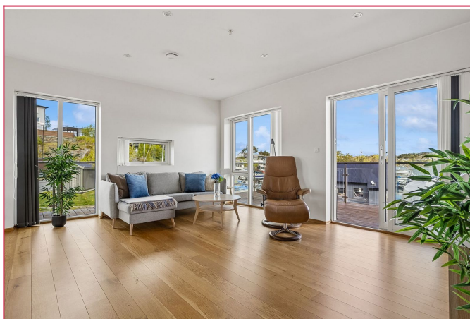
Stuen er gjennomgående med godt lysinnslipp