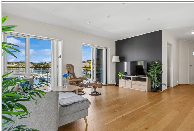
Lys og innbydende stue med innfelte spotter i himlingen