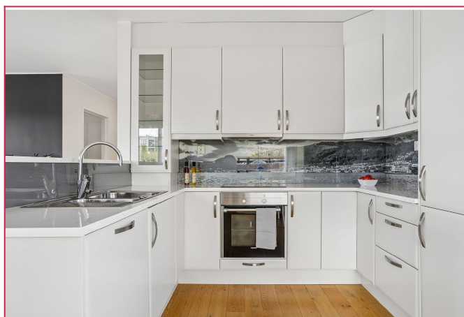
Kjøkkenet har barløsning mot stuen