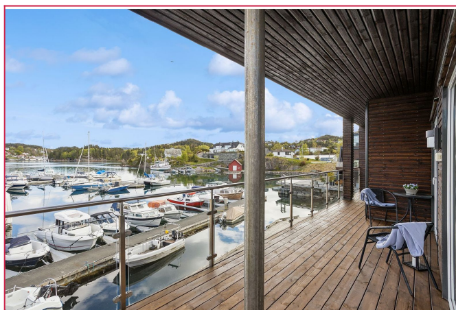
Overbygd uteplass med utgang fra stuen