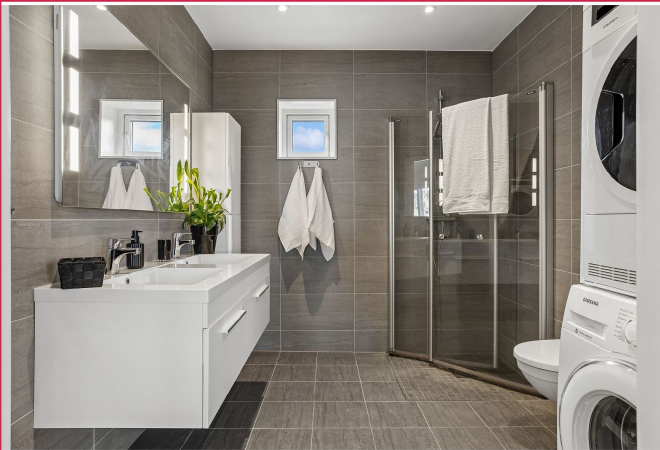
Lekker baderom med varmekabler i gulvet