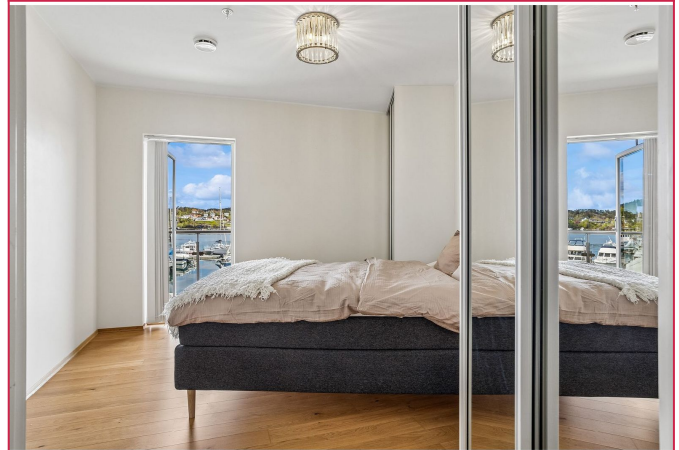
Hovedsoverom med dobbeltseng