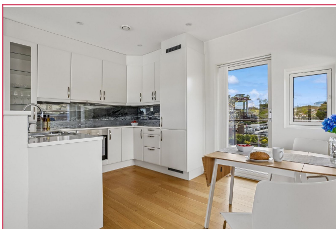
Lyst kjøkken med integrerte hvitevarer