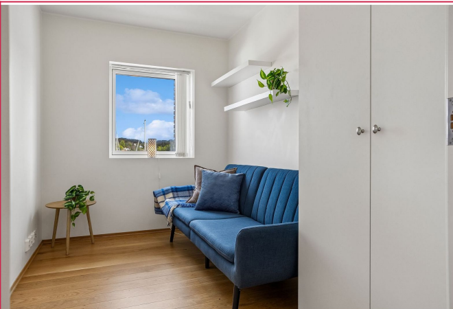
Soverom nr 2 med sovesofa