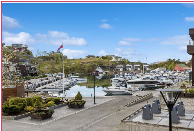
Uteplass med utgang fra stuen