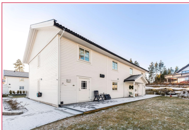
Velkommen til Vinkelhaken 13B!