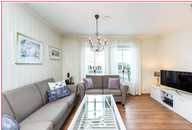
Romslig stue med god plass til sofagruppe og tv.