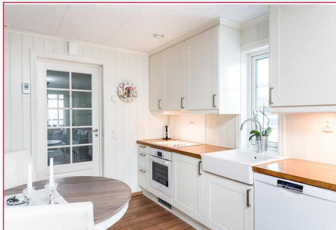
Stillfult hvitt kjøkken med både integrerte og frittstående hvitevarer.