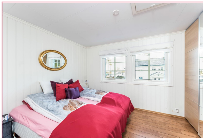
Hovedsoverom med god plass til seng, nattbord og annet tilhørende møblement.