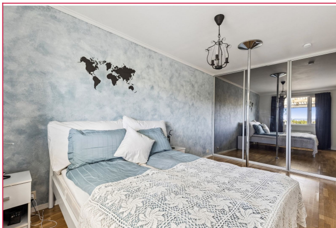
Stort soverom med skyvedørgarderobe.