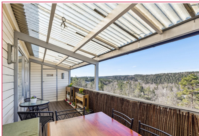
Stor balkong med fantastisk utsikt.