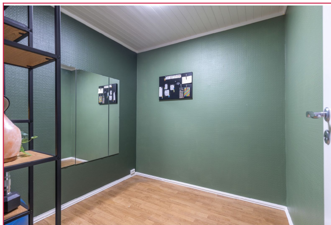
Kontor/ disponibelt rom.