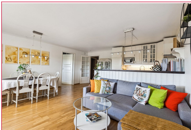
Leiligheten leies ut delvis møblert.