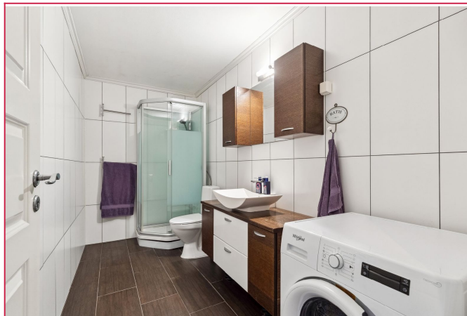
Stort bad med vaskemaskin.