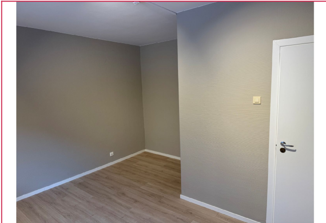
Plass til seng.