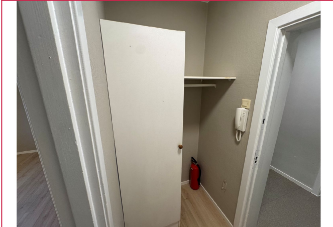
Skap i gang.