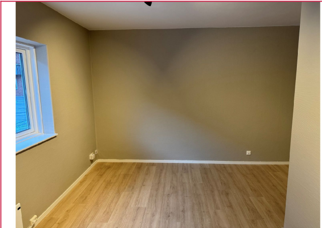
Plass til sittegruppe