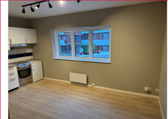
Store vinduer som vender inn mot bakgård.