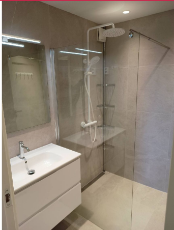
Nylig oppusset bad.