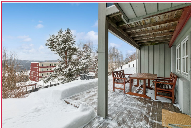
Boligen har en egen uteplass med flott utsyn.