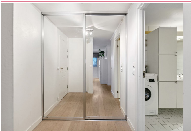
Garderobeskap for ekstra oppbevaring.