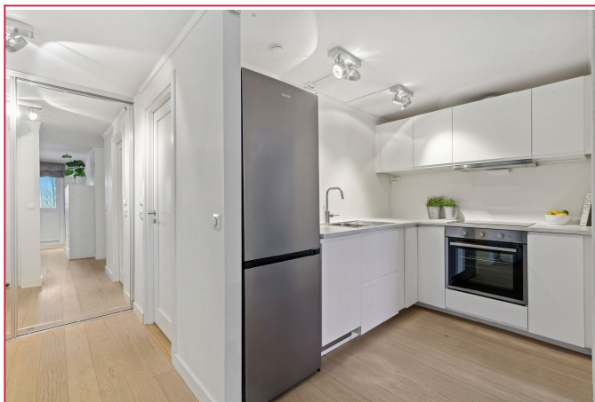
Det er varmemåte under parketten, og det er peis i stuen