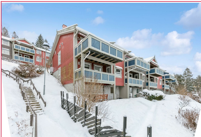
Boligen er en attraktiv og oppusset 2-roms sokkelbolig i naturskjønne omgivelser.