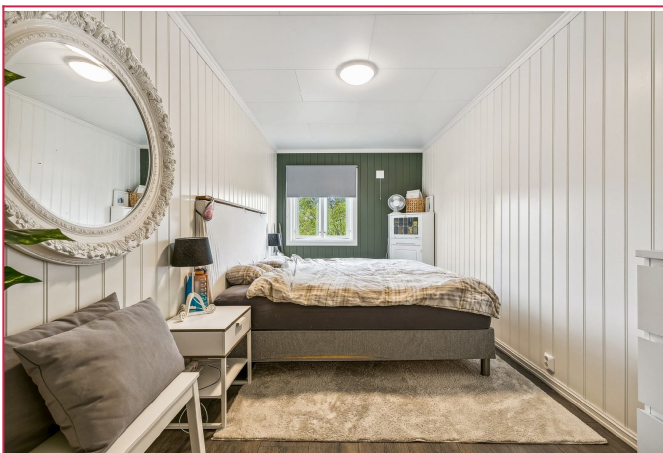
Boligen har store 4 soverom