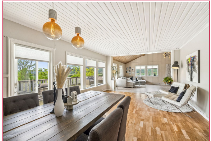
Stue og spisestue med god takhøyde og store vinduer!