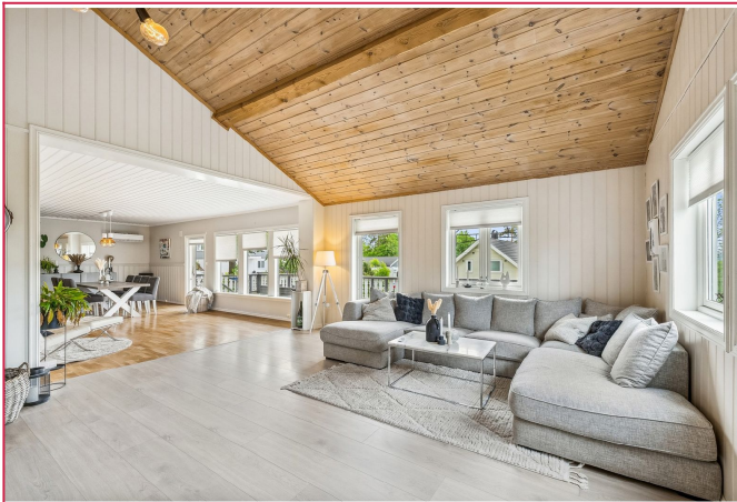
Stor og innholdsrik enebolig på Kløvstad!