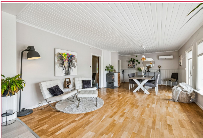
Peisovn i både stue og spisestue. Varmepumpe. Samt vannbåren gulvvarme