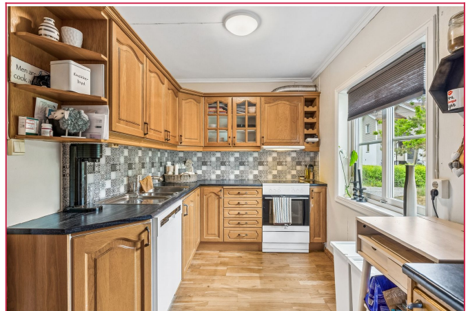
Kjøkken med god skap- og benkeplass. Oppvaskmaskin og kombiskap følger med