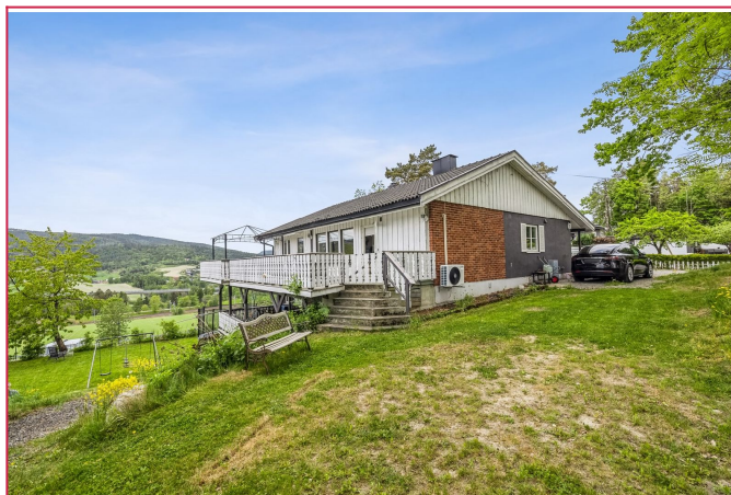
Velkommen til visning!